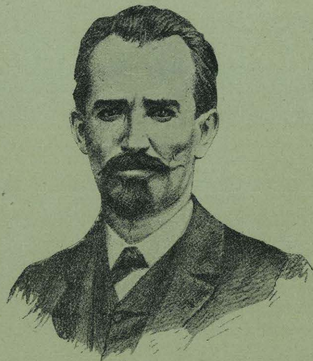
GENERAL MANUEL GONZALEZ.

Después de la narración interesante, de cómo se establecieron las relaciones de amistad íntima entre el General Díaz y Manuel González, relaciones que sólo terminaron hasta que González murió después de haber sido presidente de la República durante un