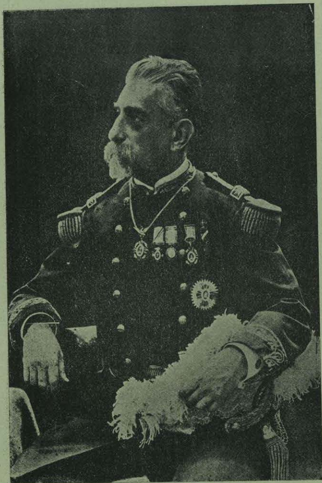
GENERAL FRANCISCO P. TRONCOSO.