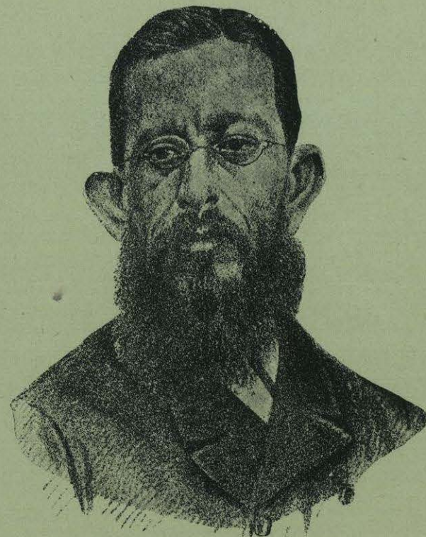
GENERAL MARIANO ESCOBEDO.

El General Díaz relevó al General Mariano Escobedo, cuyas fuerzas habían sufrido terriblemente en la defensa de la línea; mas como la orden de retirarse había sido dada á este último antes que llegaran las fuerzas que lo iban á relevar, cuando éstas llegaron ya las tropas habían desocupado el edificio del