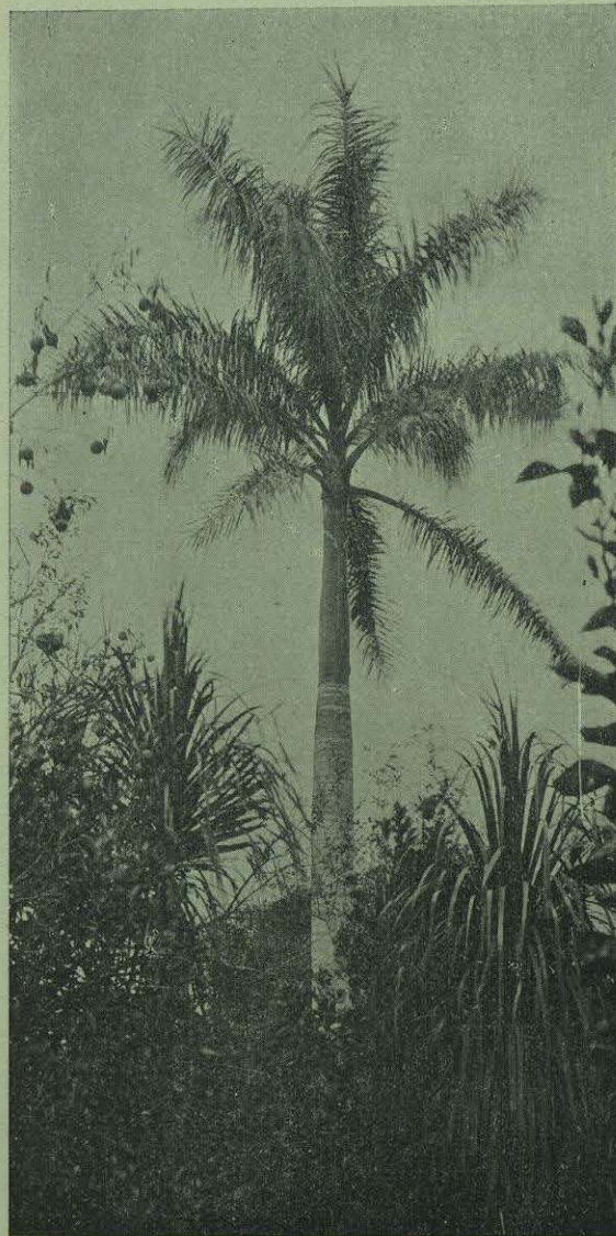
UN PAISAJE DE TIERRA CALIENTE.