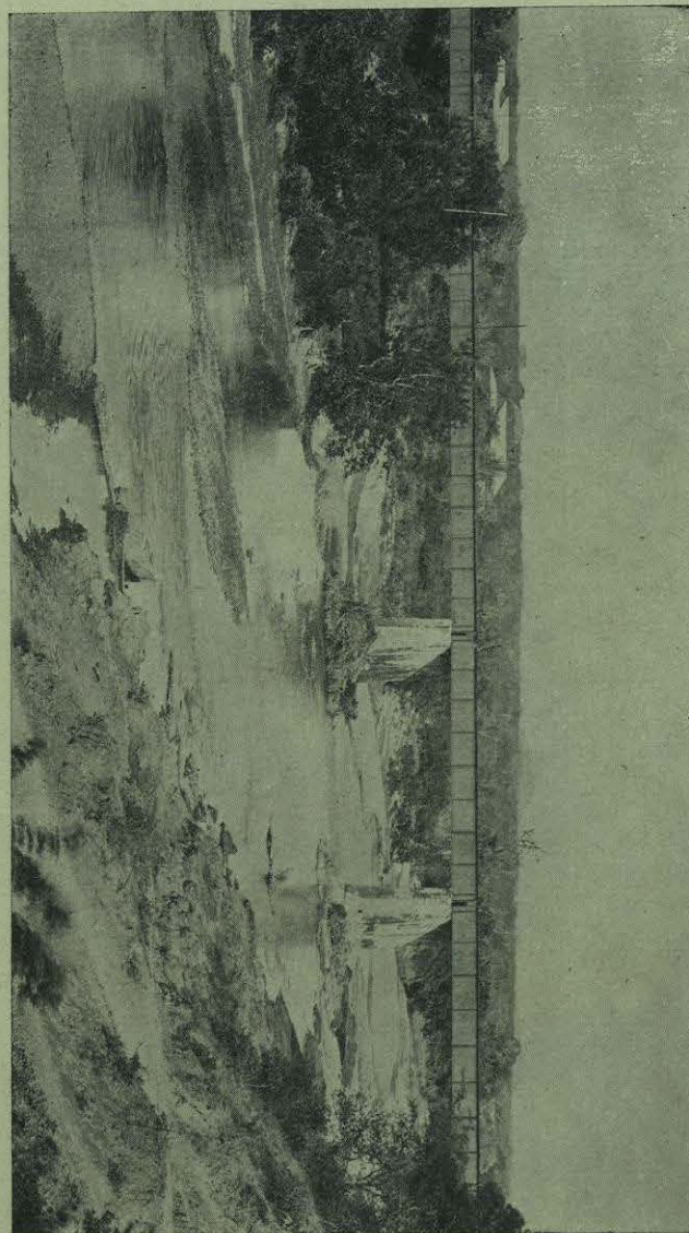
PUENTE DE SAN GERÓNIMO, OAXACA.

Poco tiempo después, cuando las fuerzas de Landa, Salinas y Díaz estaban en Teococuilco, se supo que andaba cerca de allí un cuerpo de tropas conservadoras y que marchaban sobre esa ciudad. Landa, que hacía algún tiempo estaba descontento con la posición que ocupaba, decidió dejar su puesto, entregando á Salinas el mando de las fuerzas, y regresar á