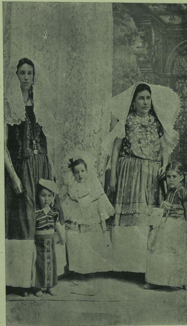
UNA FAMILIA TEHUANA.

El que un joven de talento y ambicioso de éxito en