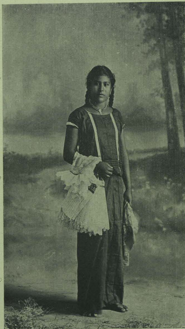
INDIA DE TEHUANTEPEC.

En aquellos tiempos eran tan escasos los medios de comunicación entre la Capital y el Istmo, que con frecuencia transcurrían de tres á seis meses sin comunicación entre el Gobernador y el Gobierno central. Por lo tanto, Díaz quedó casi abandonado á sus propios recursos. En medio de sus constantes luchas contra los indios y cabecillas reaccionarios, halló tiempo para impulsar la educación, el comercio, actividad mercantil y las industrias nativas. Poco á poco los indios se dedicaron á trabajar; los ranchos y plantaciones comenzaron á florecer; el tráfico á través del Istmo se tornó seguro; se abrieron escuelas en las principales poblaciones y pueblos; el mercado