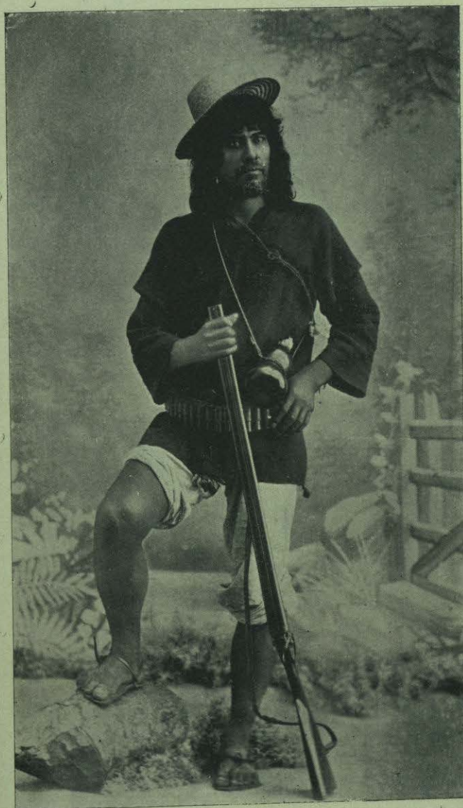
GUERRERO DE OAXACA.

Todavía existen abusos en México y existirán aún