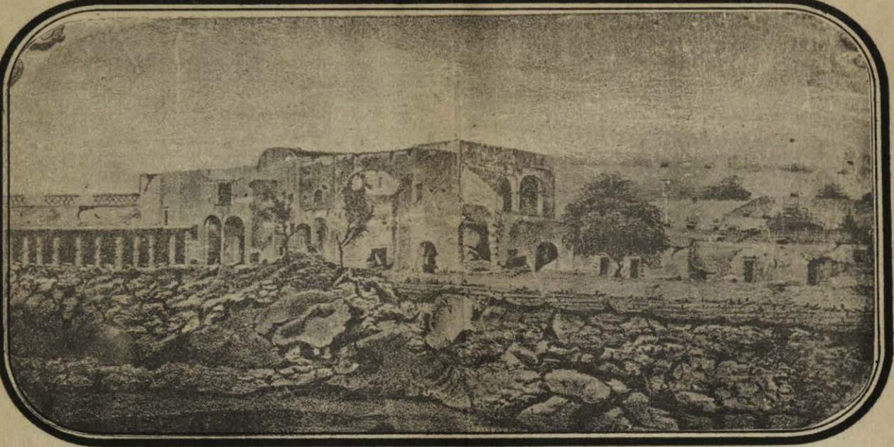
HUERTA DE STA. INES.

Las obras de la plaza están marcadas con tinta roja, y las de los franceses con tinta azul. Las manzanas que fueron ocupadas por los franceses están entintadas de azul claro. Las distancias tomadas desde los fuertes se han contado á partir de su centro.