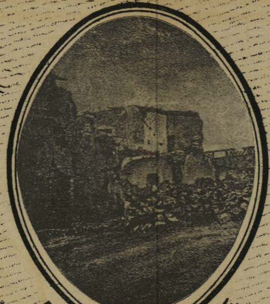
PITIMINI AL PONIENTE