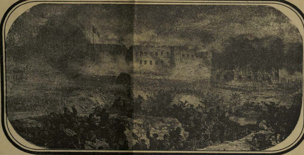
TOMA DE LA PENITENCIARIA.