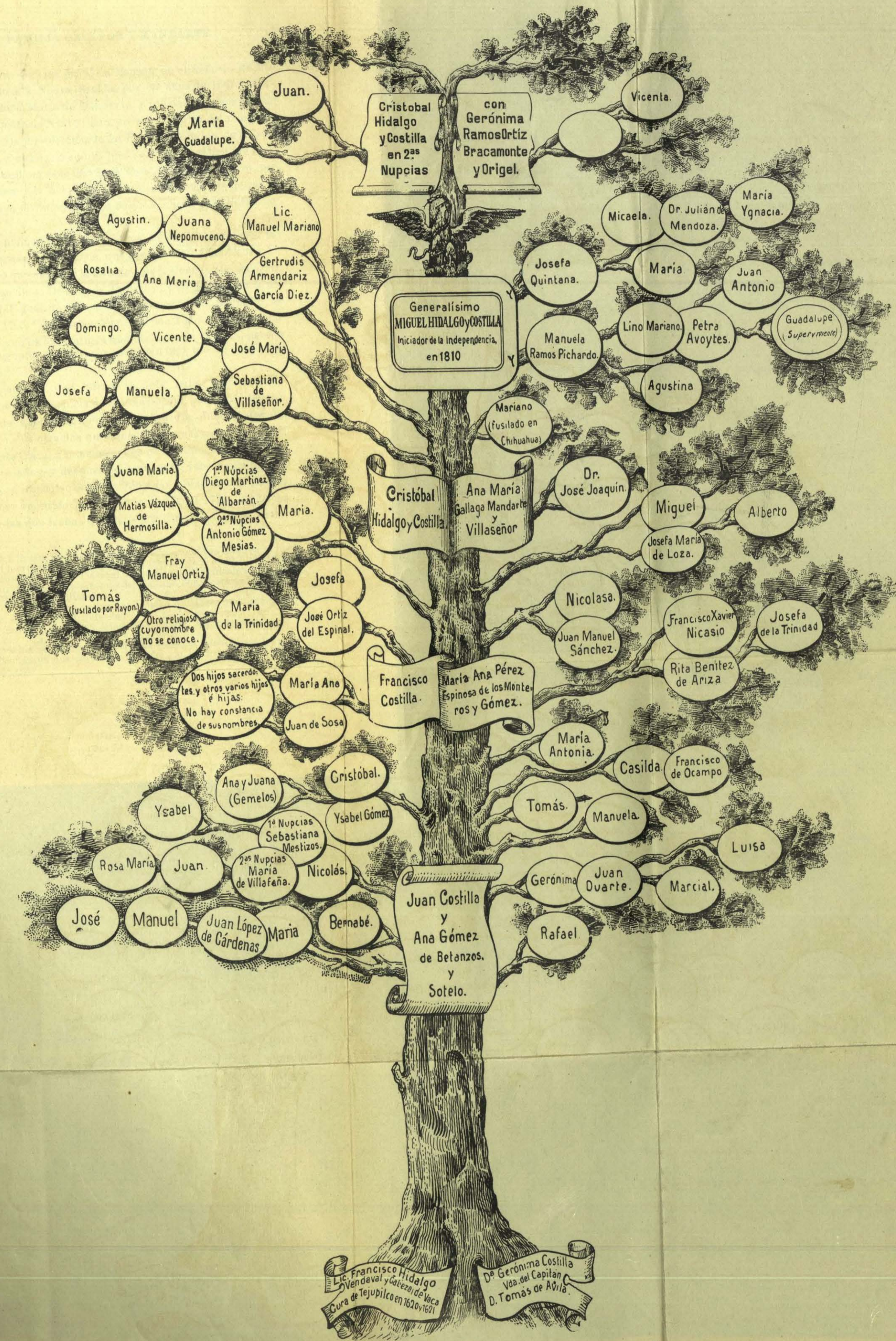
ARBOL GENEALÓGICO DE LA FAMILIA HIDALGO Y COSTILLA.