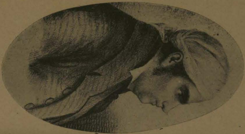
José María Morelos.