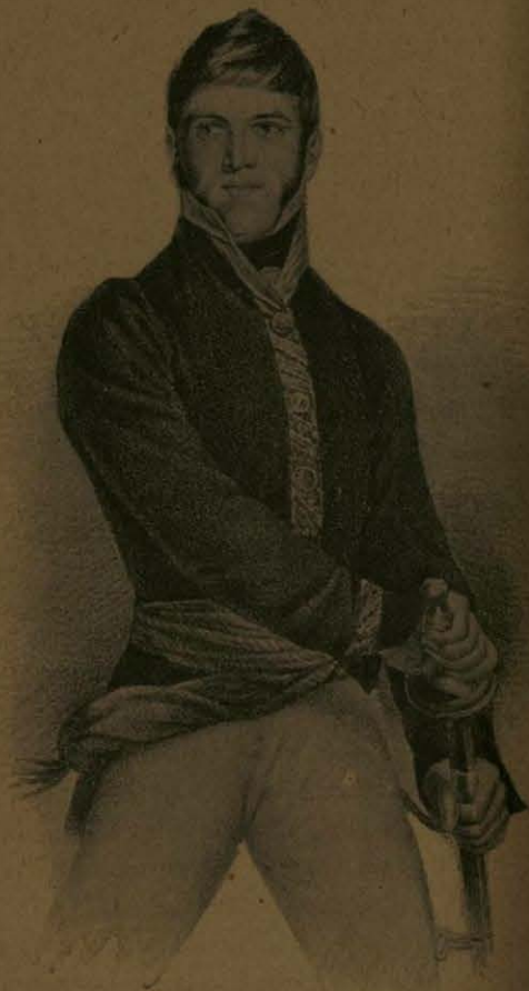
D. Francisco Javier Mina. Sacado de un retrato grabado en Londres.