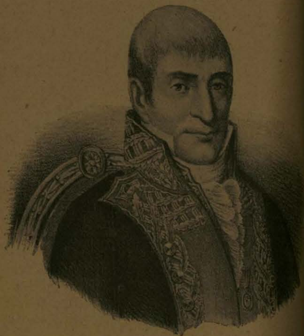
D. Félix María Calleja, Virrey de Nueva España.