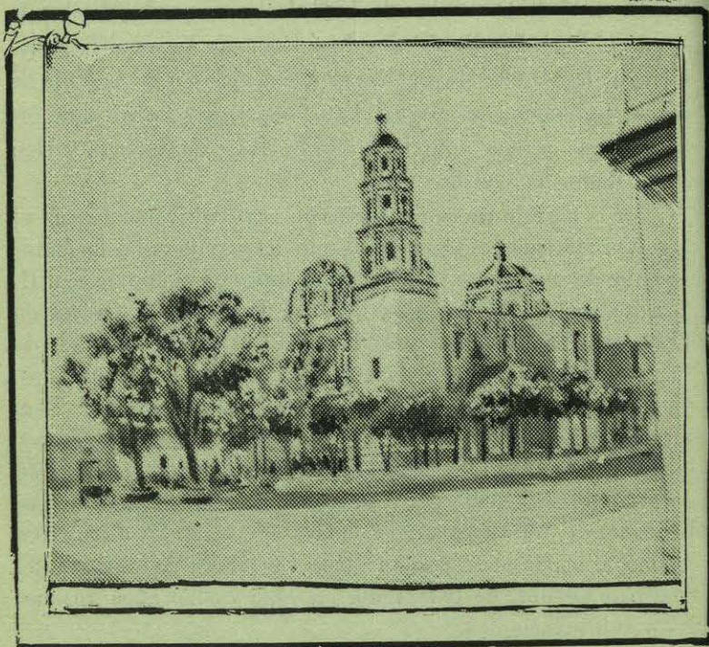
IGLESIA DE CIENEGA DE MATA.

formación citada, siempre se firmó Francisco Primo Verdad y Ramos.