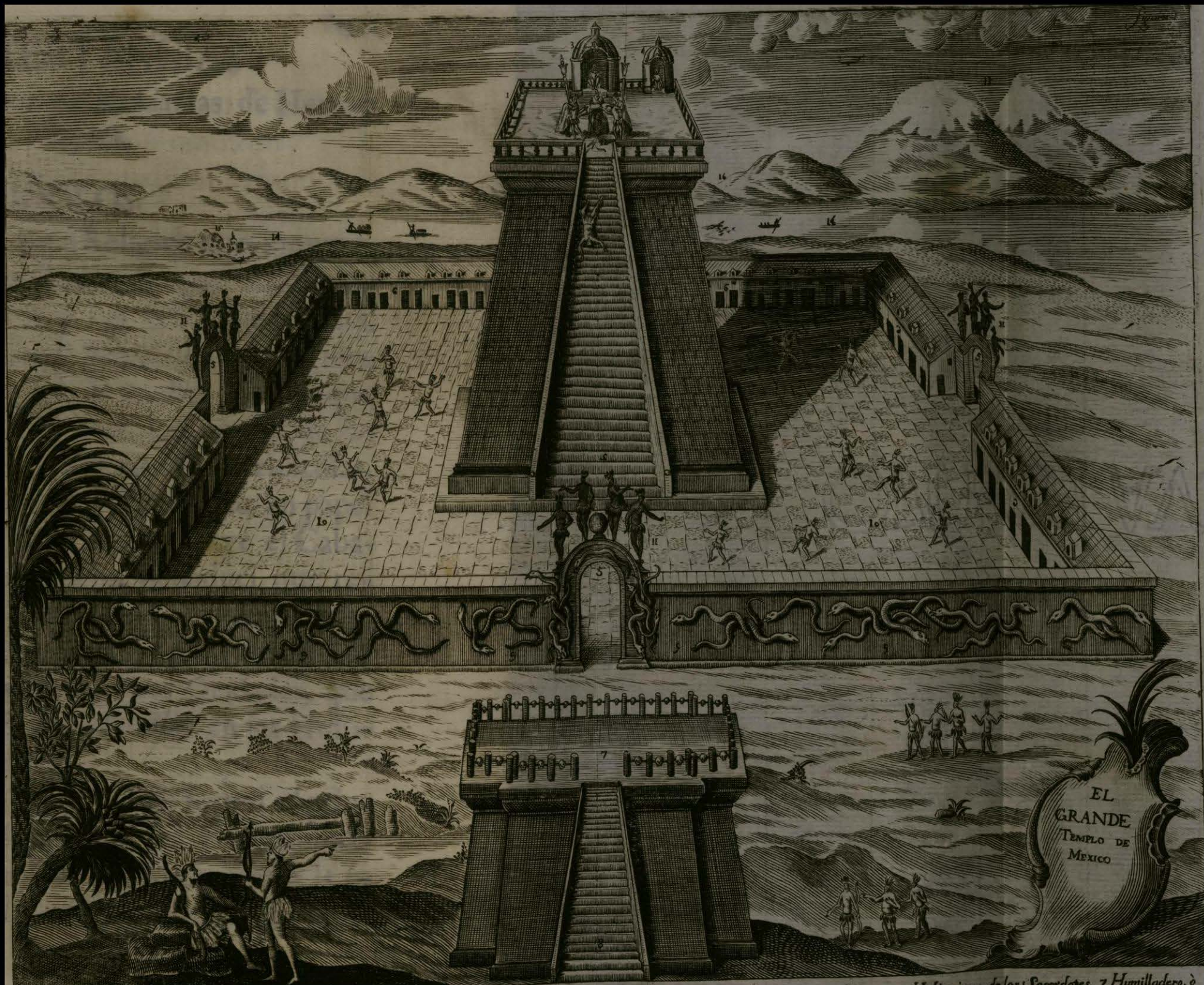
1. Plaza donde estaban los Idolos. 2. Escalera de 120 gradas. 3. Idolo Huitzilopostli. 4. Idolo Tlaloch. 5. Puertas, ò entradas à los quatro Vientos. 6. Habitaciones de los Sacerdotes. 7. Humilladero, ò Sitio donde ponian las Cabezas de los Sacrificados encadenados en unas Varas citadas a Maderos. 8. Escalera de 30 gradas para el Humilladero. 9. Figuras de Serpes adorno de el Petril ò Muralla de la Pla- za del Templo. 10. Plaza de el Templo donde danzaban ocho, ò diez mil Indios y alas Danzas llamaban Mytotes. 11. quatro Estatuas de Idolos que estaban sobre cada Puerta de la Muralla. 12. Perma de los Sacrificios de Hombrs sobre una Piedra. 13. Volcanes de Mexico. 14. Laguna de Tetzcaco. 15. Peñol de los Baños. 16. Peñol del Marques.