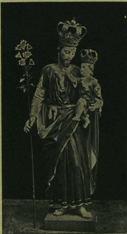
Señor San José, rogad por nosotros.

honrado comerciante de Veracruz que era Presidente del