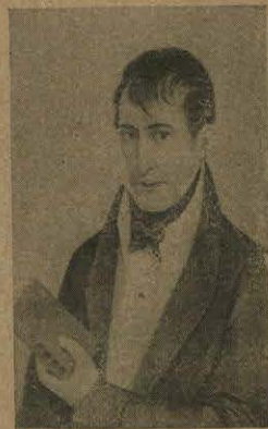
El Pensador Mexicano.