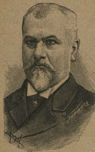
Lic. Justo Sierra.