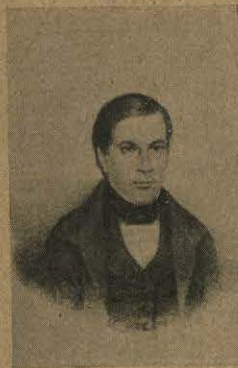
Dr. José María Luis de Mora.