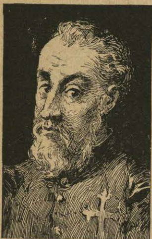
El Capitán Diego de Ordaz, del reino de León.

Por envidias y maledicencias contra Cortés, cambió bien pronto Velázquez su buena voluntad y entusiasmo en desconfianza, llegando hasta á pensar quitarle el mando. Apercebido de ello Cortés, activó sus preparativos y anticipó la