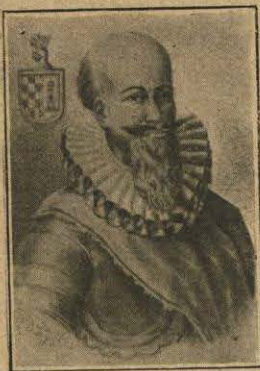
Bernal Díaz del Castillo. (Original en el Ayuntamiento de Guatemala.)