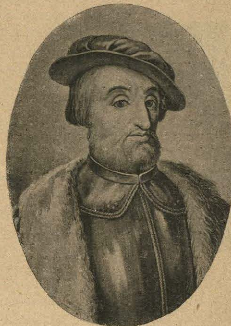
Hernando Cortés al emprender la conquista de México. (De una medalla del siglo XVI.)

Era muy ágil y ducho en toda clase de operaciones corporales, y poseía buena salud para soportar todo género de luchas y privaciones, sabiendo entusiasmar de tal modo con su ejemplo y brillante palabra á sus compañeros en la hora del peligro, que los aguijoneaba á realizar las más temerarias empresas.