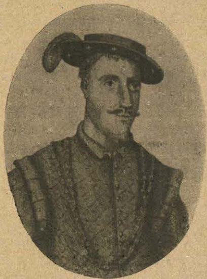
Juan de Grijalva. ( Décadas de Herrera. )

Al cabo de otros tres días saltaron á tierra para hacer aguada en un lugar de la laguna de Términos, que llamaron Estero de los lagartos , regresan-