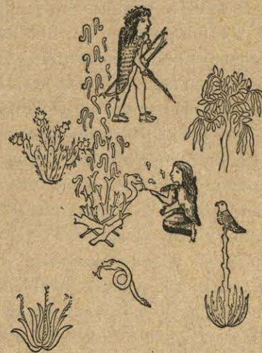
Costumbres chichimeca, según el Mapa Tlotzin .

Las mujeres vestían un poco mejor, y en materia de dijes y adornos eran más parecas que los hombres. Se casaban éstos con una sola mujer y no había de ser pariente suya. No tenían ídolos ni templos; tributaban culto, al aire libre, al Sol-padre y á la Tierra-madre ,