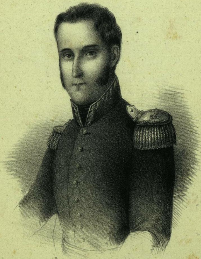
EL EX. mo S. r G. ral D. MANUEL DE MIER Y TERAN.