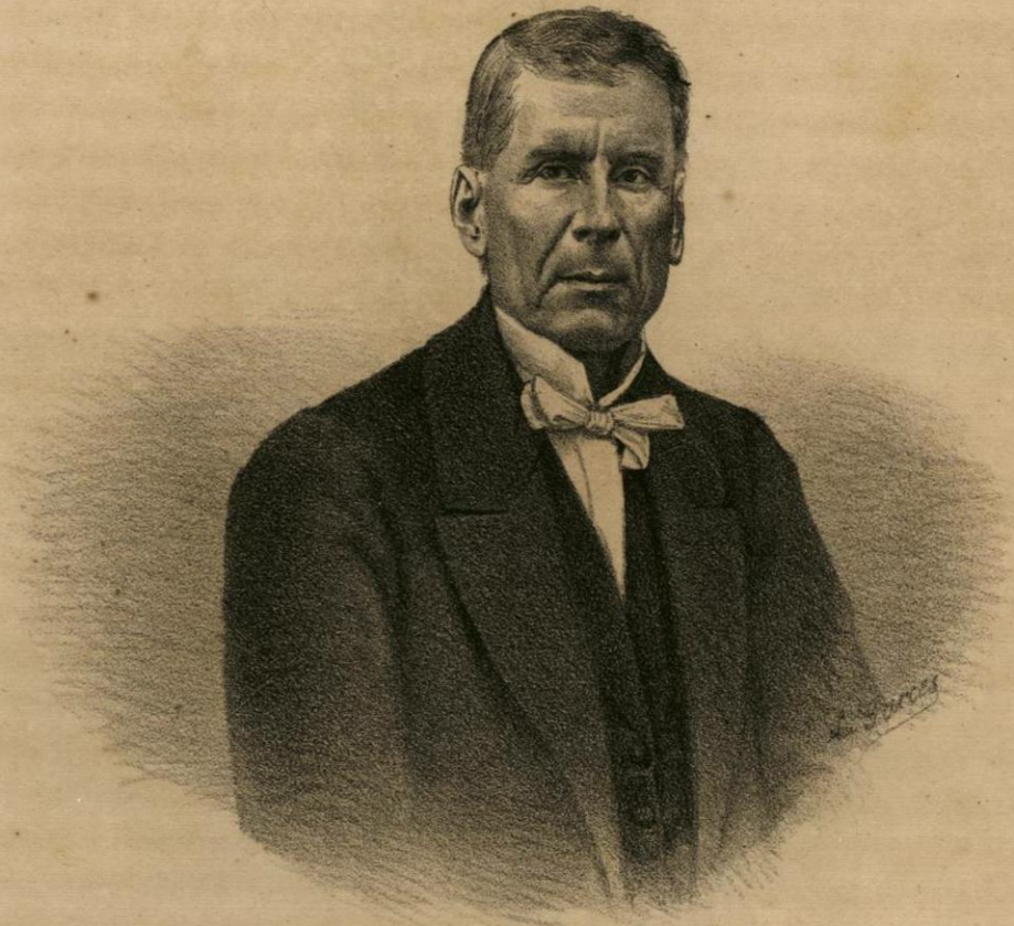
D o SANTIAGO VIDAURRI.

Adherido al Imperio fué Presidente del Consejo de Ministros de Maximiliano y Ministro de Hacienda en Abril de 1867.