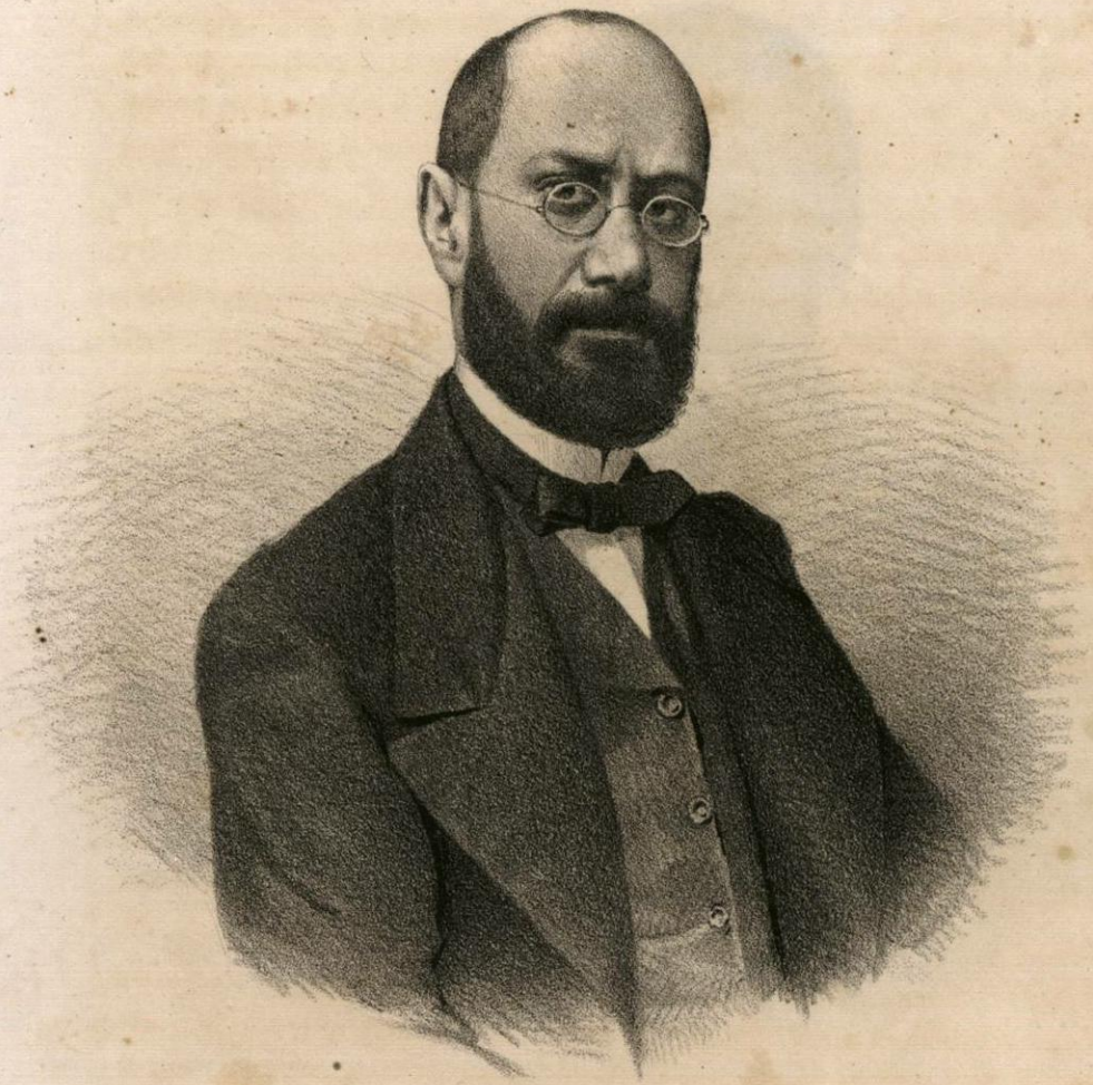
D. o JOSE M. a IGLESIAS.

Ministro de Justicia de Enero á Mayo de 1857, de Hacienda de Mayo á Sept. o del mismo año, y de Gobernacion de Set. o de 1868 á Oct. o del siguiente año. Ocupó el ministerio de Justicia en el largo periodo de Set. o de 1863 hasta Jul. o de 1867 con interrupcion de un mes, y en Oct. o de 1869. tambien despachó el ministerio de Hac. da de Enero á Mayo de 1864.