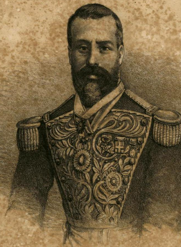
DR LEONARDO MÁRQUEZ.

Fue nombrado por Maximiliano Iugarteniente del Imperio. Tuvo un encargo diplomatico en Turquía