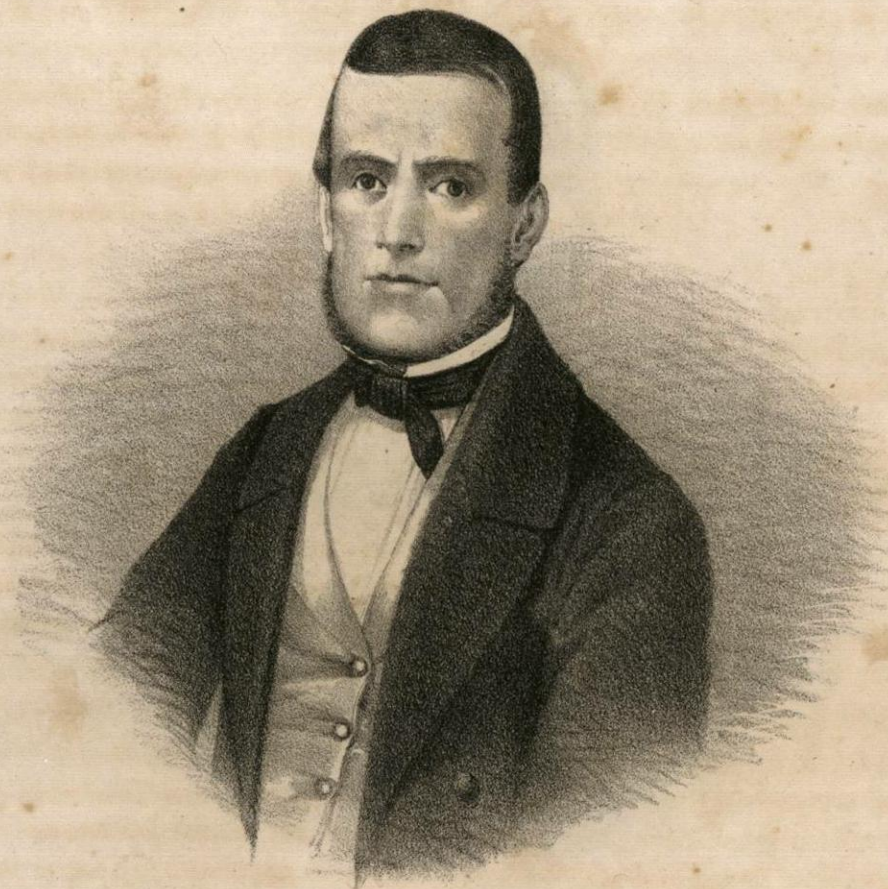
DN MIGUEL LERDO DE TEJADA.

Ocupó el ministerio de Fomento: de Octubre á Dic. o de 1855, de Febrero á Mayo de 1859 y de Dic. o de este año á Enero de 1860. En el ministerio de Hacienda estuvo: de Mayo de 1856 á Enero del siguiente año; de Febrero á Julio de 1859, y de Dbre. de este año á Mayo de 1860. En el ministerio de Relaciones despachó en Noviembre y Dbre. de 1856.