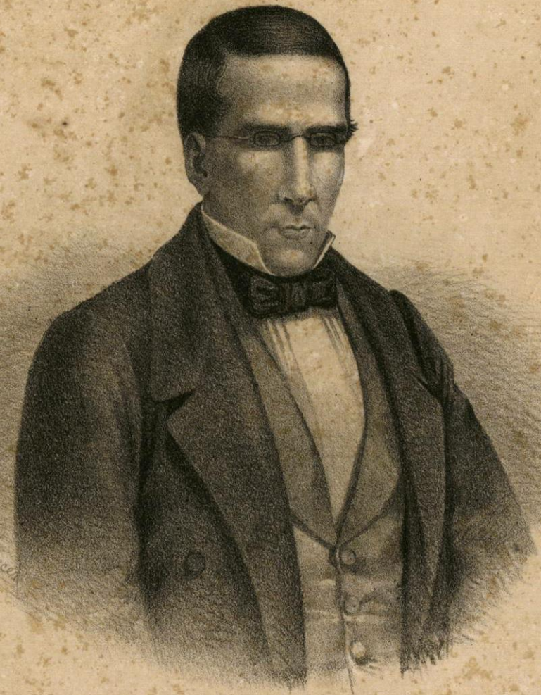
D. o SANTOS DEGOLLADO.

Fue Gral. en jefe del ejército liberal de Occidente en 1838, con amplias facultades desde que se embarcó en el Manzanillo el Presidente Benito Juárez.