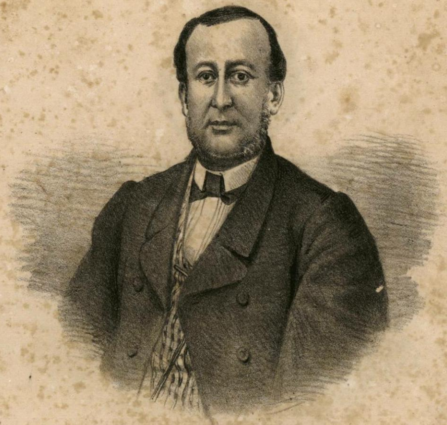
D o MANUEL DOBLADO

Fue Ministro de Relaciones, Gobernacion y Encargado de la Hacienda en 1862. Pactó los Preliminares de la Soledad por los cuales las Potencias aliadas reconocian al gobierno constitucional de México.