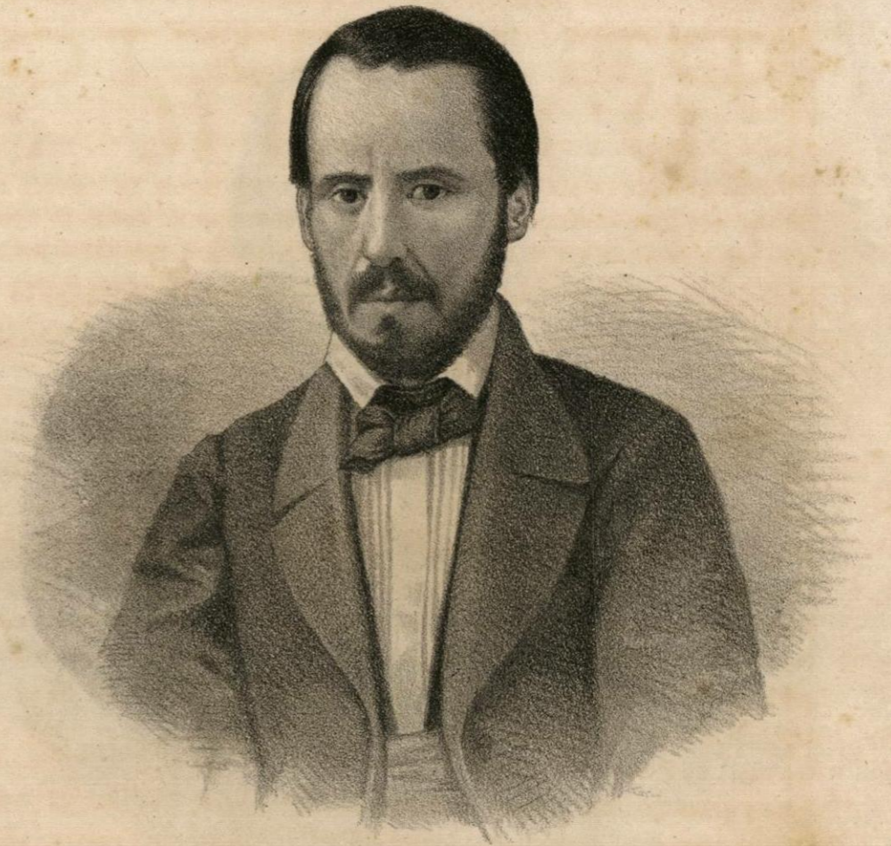
GRAL. D. o ANTONIO CORONA.

Ministro de la Guerra de Abril de 1859 á Dbr̄. de 1860. Durante ese tiempo tomó algunas veces el mando de la capital. En 1854 fué Gobernador del Estado de Veracruz.