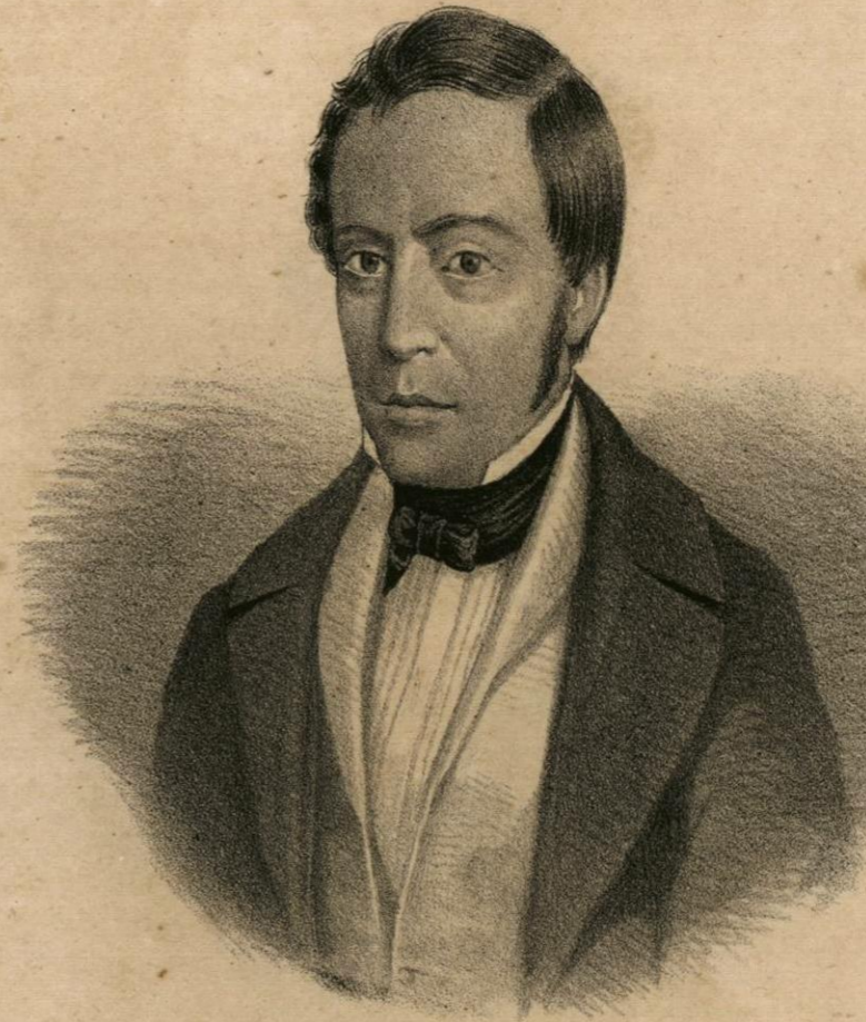
D. o LUIS DE LA ROSA.

Ministro de Hac. da de Marzo á Agosto de 1845, de Justicia en Mayo de 1847 y único ministro de Sbr̄e. d. N̄bre. del mismo año, cuando el gobierno gr̄al. se instaló en Querétaro; quedando en Justicia y Hacienda hasta Enero de 1848. Ocupó el Ministerio de Relaciones y el de Hacienda desde esa época hasta Junio del mismo año. Volvió á ocupar el ministerio de Relaciones en Dbre. de 1855 hasta Agosto del siguiente año.