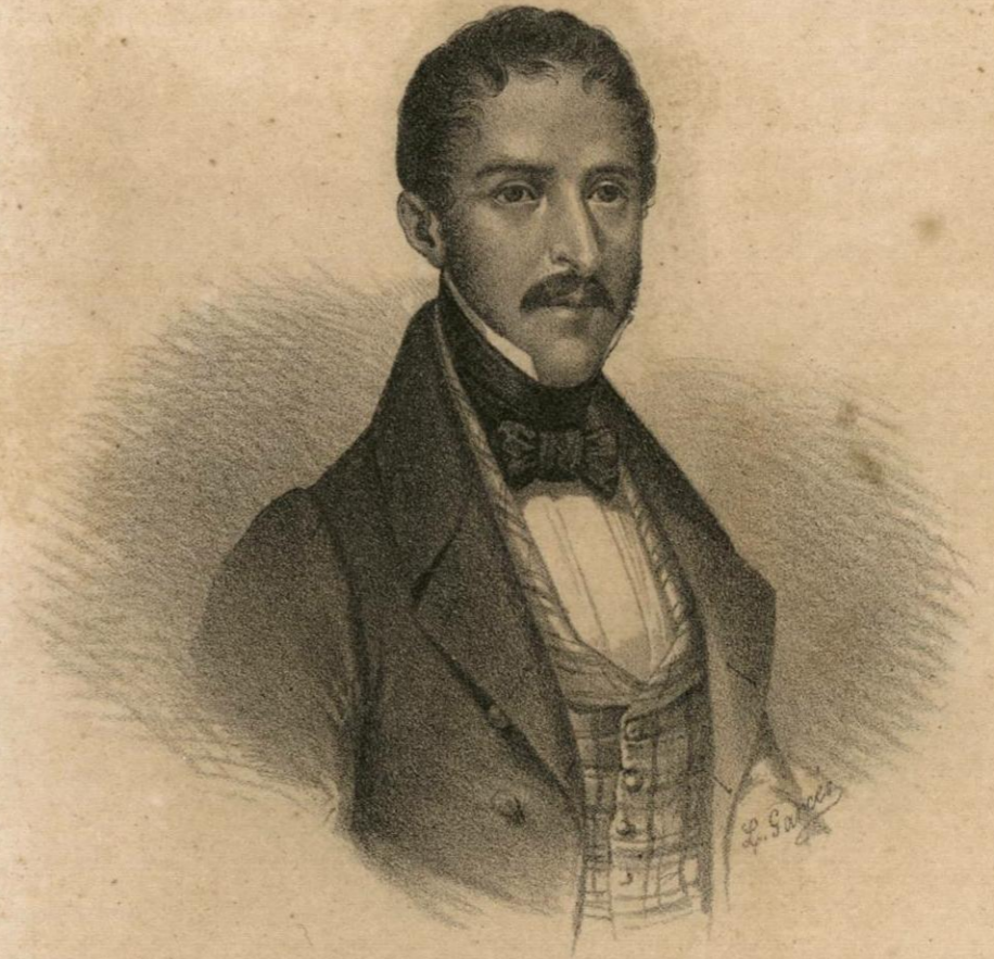
D. JOSÉ GOMEZ DE LA CORTINA.

Ministro de Hacienda de Dbre. de 1838 á Mayo de 1839