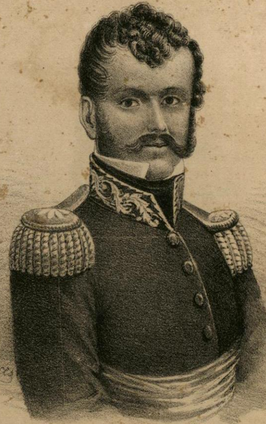
GRAL. D. JOSÉ ANTONIO ECHAVARRÍ.

Proclamó el Plan de Casa Mata, que trajo la abolición de la monarquía y sostuvo el principio de que la soberanía reside esencialmente en la Nación, secundando el Acta levantada en Veracruz en 6 de Dbre. de 1822.