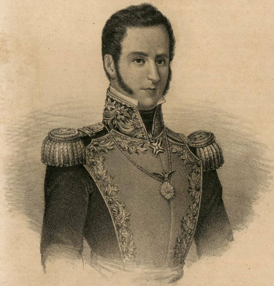
GRAL. D. n JOSÉ MARIA TORNEL.

Ministro de la Guerra en Enero de 1835 hasta Abril de 1837, por segunda vez de Dize. de 1838 á Agosto de 1839; por tercera de Col. de 1841 á Junio de 1844; de Febrero á Julio de 1856 y por último de Abril á Sete. de 1853. Estuvo al frente del Ministerio de Relaciones de Febrero á Marzo de 1839 y dirigió la Hacienda en Julio del mismo año.