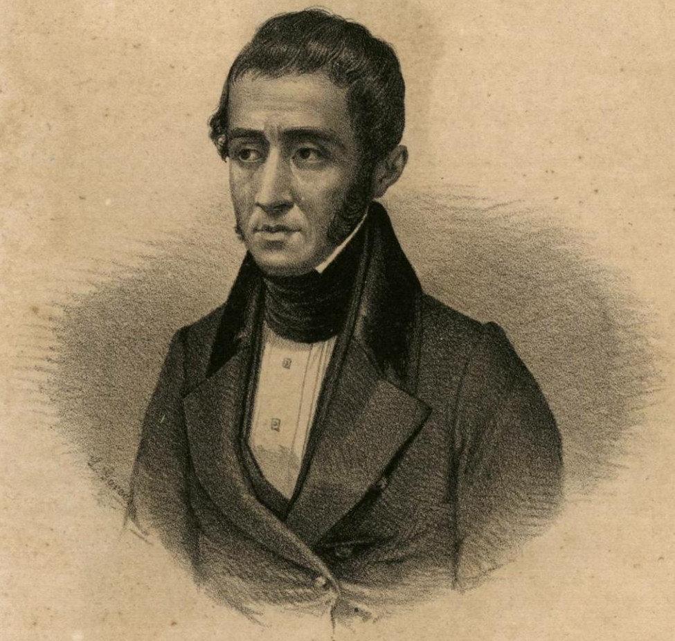
DR. LUIS G. CUEVAS.

Ministro de Relaciones en 1837, en 1845 y 49, y de Gobernacion en 1840; formó parte de la comision que concluyó el tratado de Guadalupe Hidalgo.