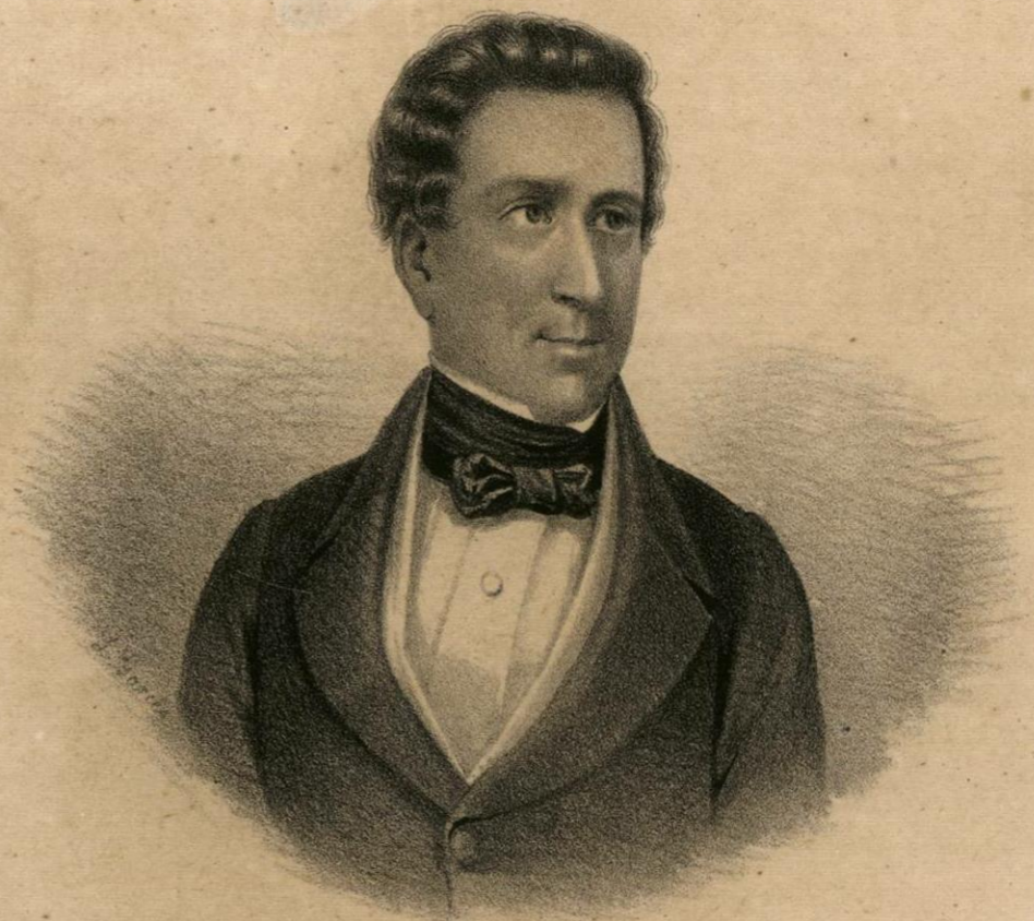
JOSÉ JOAQUÍN PESADO.

Ministro de Relaciones y del Interior en 1838.