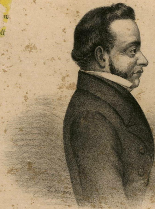
D. NO LORENZO DE ZAVALA,

Fue Presidente del congreso constituyente al expedirse la constitucion de 1824, firmandola con tal carácter.