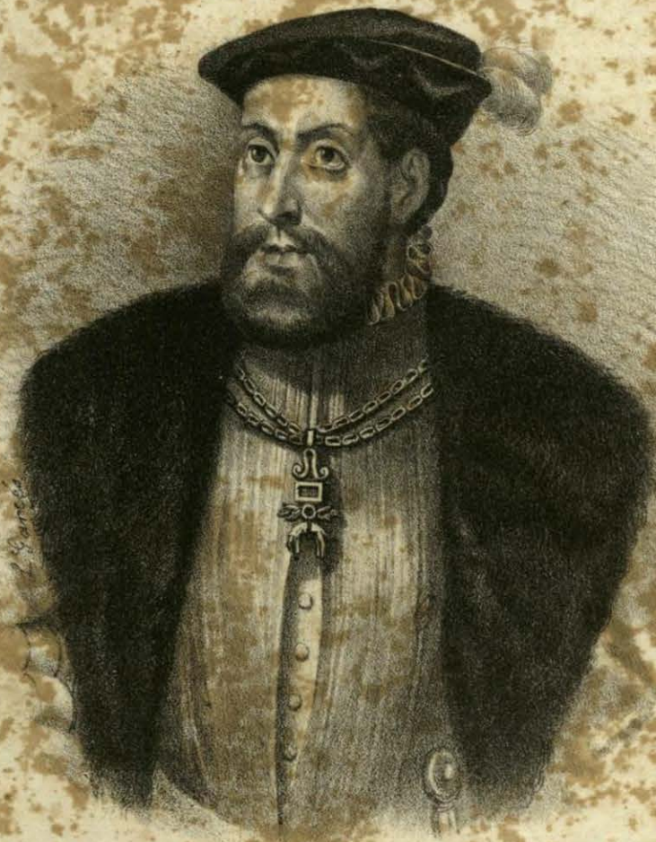
CARLOS V. DE ALEMANIA, I.º DE ESPAÑA.