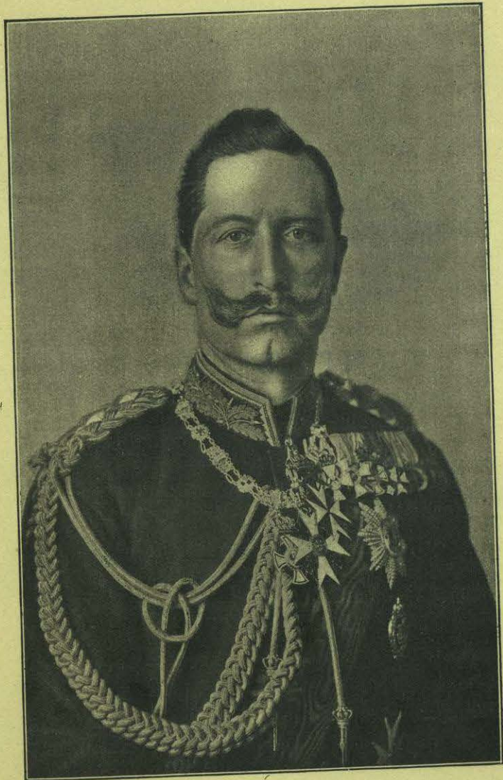
EL EMPERADOR GUILLERMO II