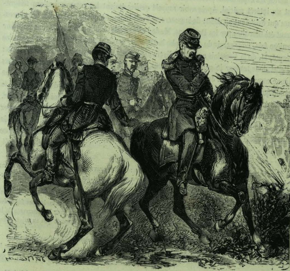
LE MARÉCHAL BAZAINE BLESSÉ PAR UN ÉCLAT D'OBUS.