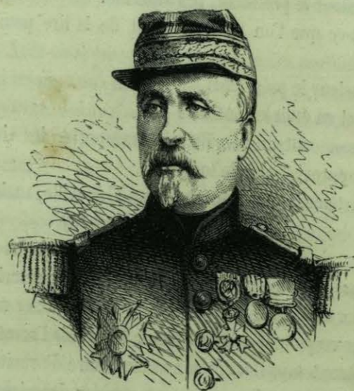
LE GÉNÉRAL DECAEN.

A neuf heures, je ne savais pas où aller me loger, j'insistai pour avoir ma dépêche et je dis à un aide de camp de prier M. le maréchal de me la donner. J'ajoutai que je ne savais pas où loger, et le priai de me laisser coucher dans son écurie; il faisait une nuit affreuse. Il me répondit qu'il n'avait pas de place. Je suis allé chez un aubergiste des environs qui n'avait pas non plus de place; je lui ai demandé de coucher n'importe où, sur une table, par terre, il m'a refusé. J'ai couché derrière un cheval en ramassant quelques débris de paille, ou plutôt de fumier.