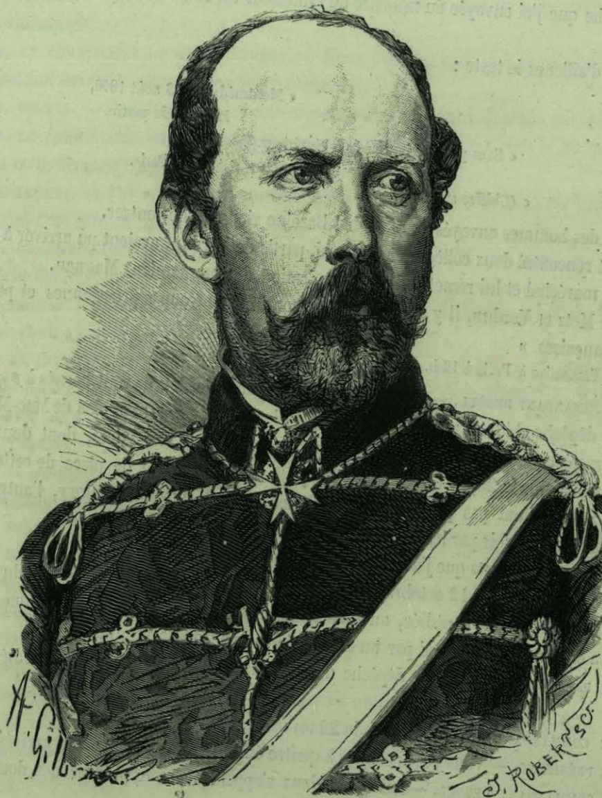
LE PRINCE FRÉDÉRIC CHARLES.

l'ont demandé ensuite, tout ce qui était de nature à leur faciliter des communications avec la place de Metz. Les inspecteurs des forêts et des douanes ont choisi parmi leurs hommes ceux qui leur inspiraient le plus de confiance, pour servir d'émissaires à ces officiers. Je n'ai