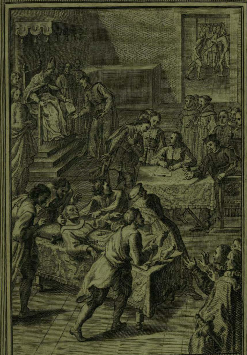
Continuan los Portentos y manda el Illmo Obispo de Puebla a un Notario, que los anote