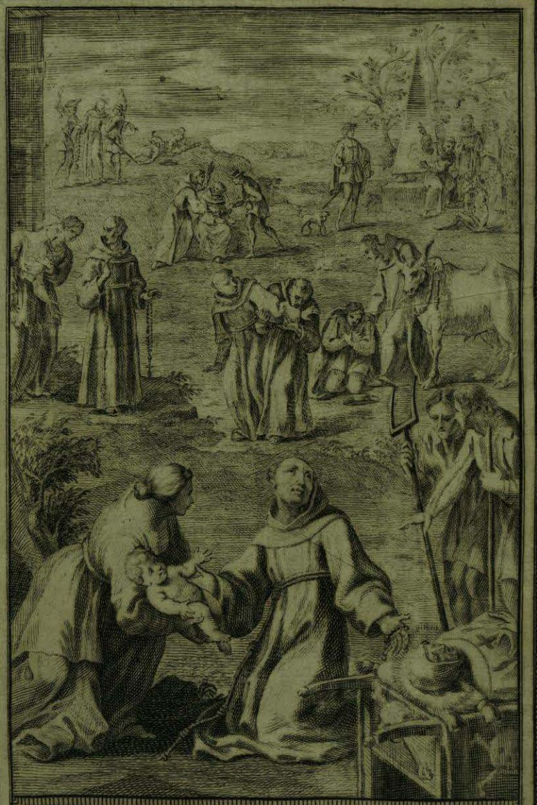
Prosigue el Señor obrando maravillas, al contacto del Cuerpo del B. o Aparizio