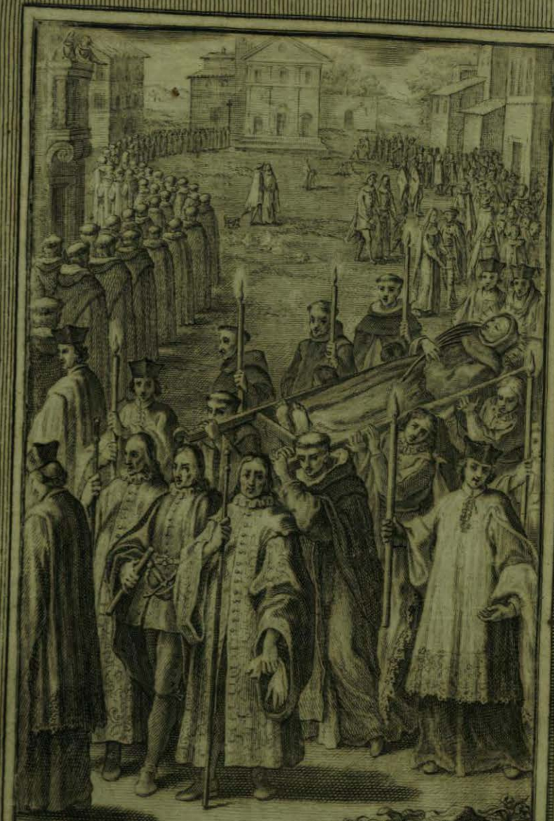
Se celebra el Entierro del Sr. Aparicio con una asistencia universal, y con el Oficio de los Parvulos —

Faint, illegible text or bleed-through from the reverse side of the page.