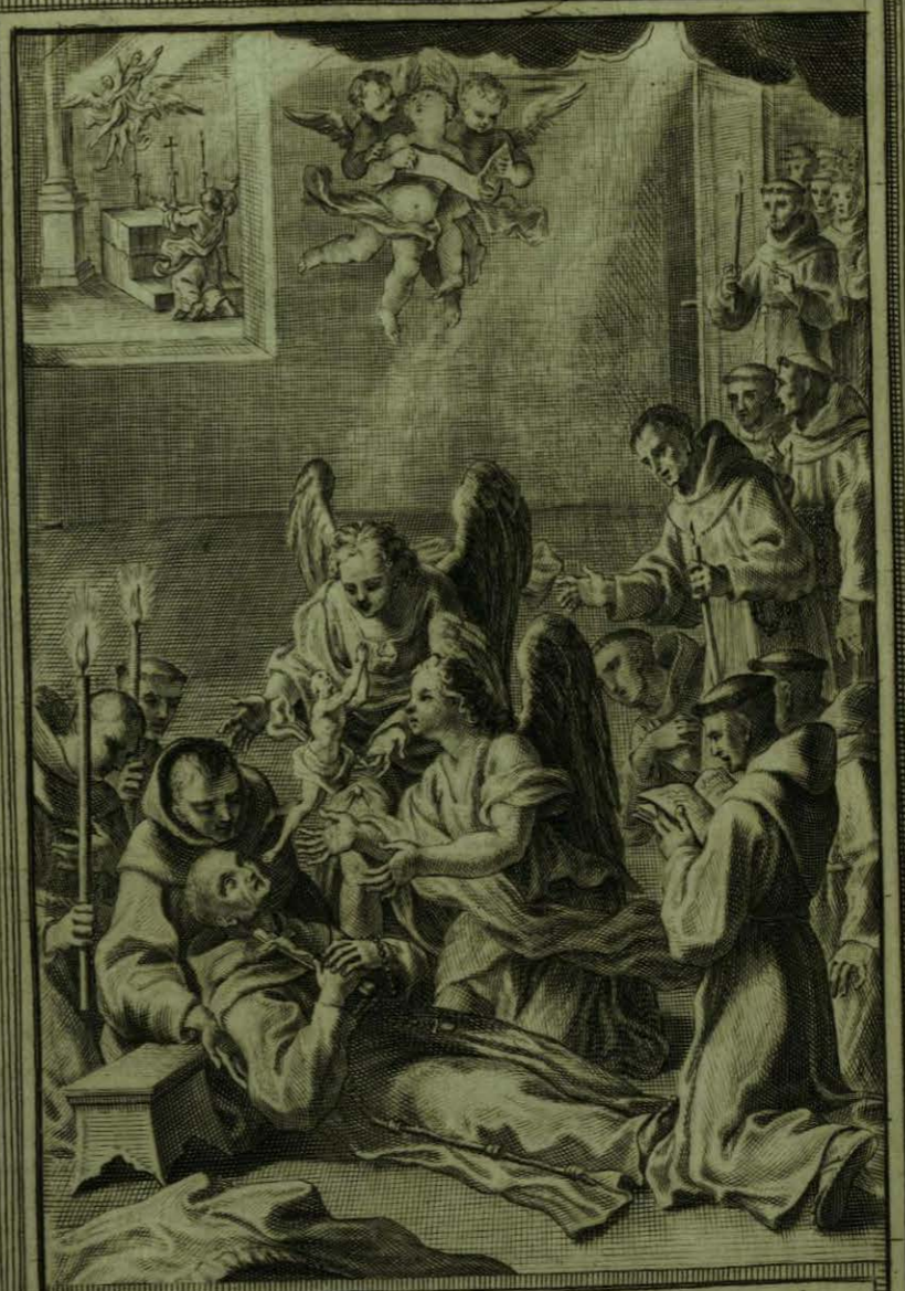
Muerto el B. o Aparicio, queda su Cuerpo suave, her- moso, y oloroso, y Dios comienza à obrar prodigios

Faint, illegible text or watermark within the large frame on the left page.