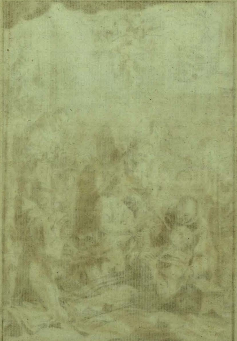
... el cuerpo de S. Apolinario, que se conserva en el Hospital de San Juan de Dios, y se muestra a los enfermos para su curacion.