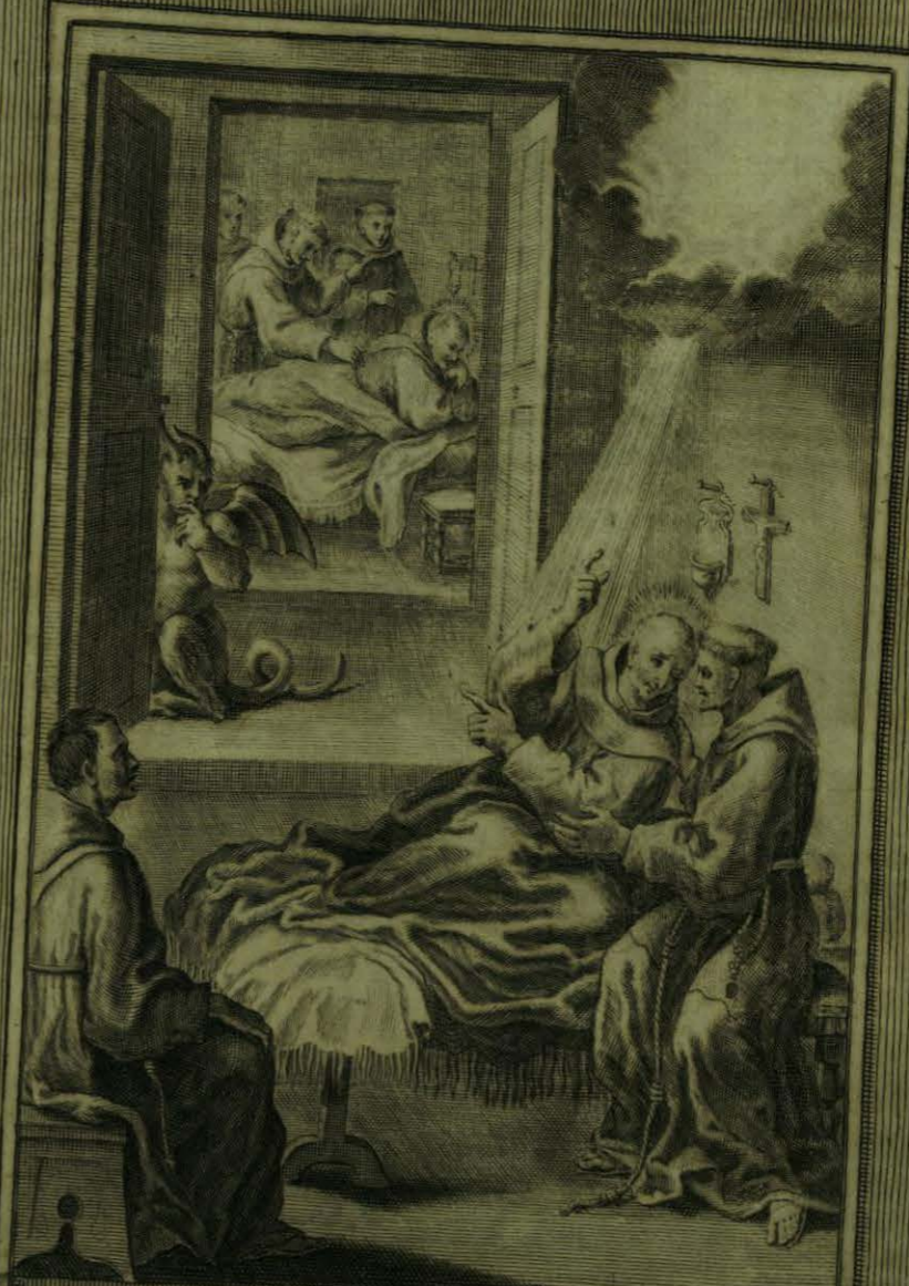
Obligado de la Obediencia, y de los Medicos, acepta Ca ma, y Zelda, reusa todo regalo y dice, que el Dios son amiras regis