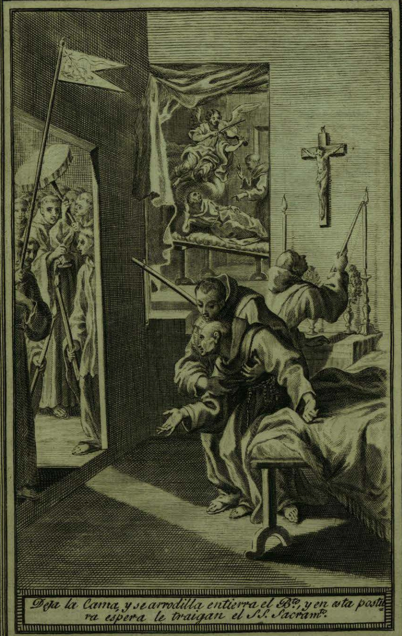
Deja la cama, y se arrodilla entierra el B o , y en esta postura espera le traigan el S. Sacram o .

Faint, illegible text or watermark within the rectangular frame on the left page.