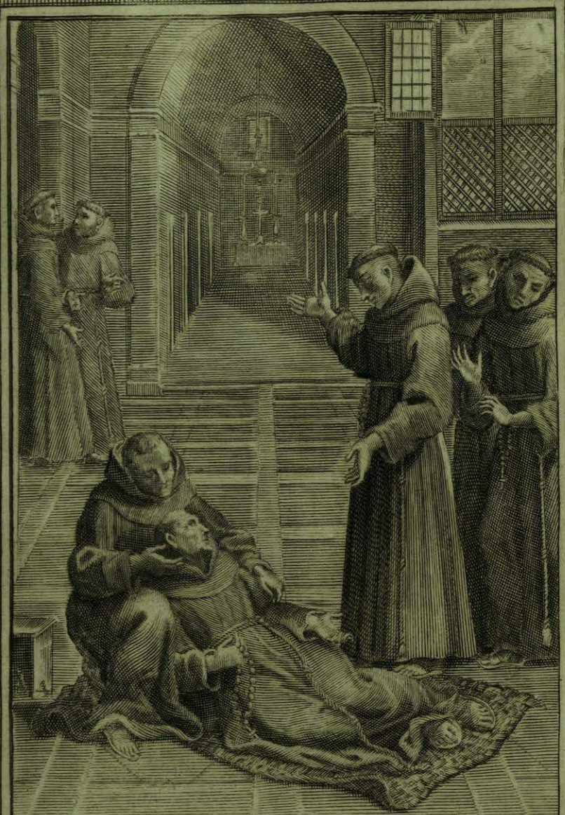
Quedase el B. o Aparizio en una estera sobre la tierra, y espera alegre la Muerte