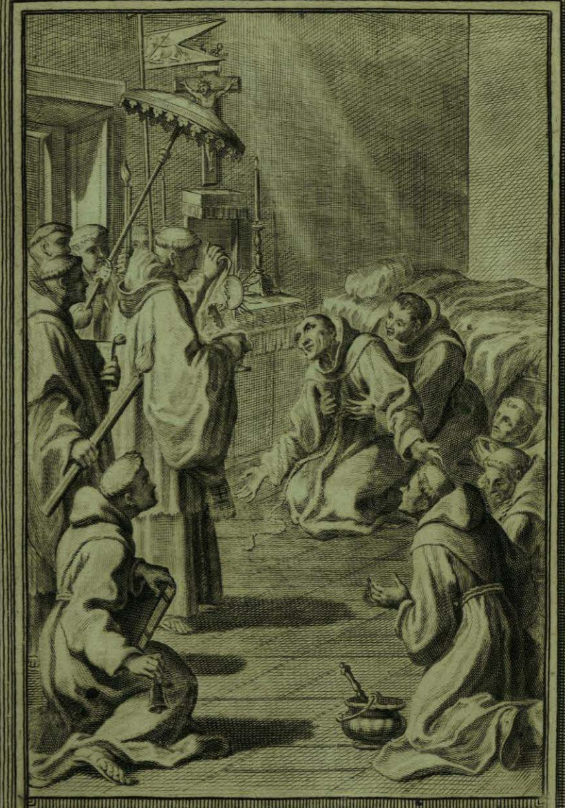
Fueto en tierra de rodillas el B. do adora el S. to Sacram. to ia que no lo pudo recibir por sus continuas vomitos

[Faint, illegible text at the bottom of the left page, possibly bleed-through from the reverse side.]