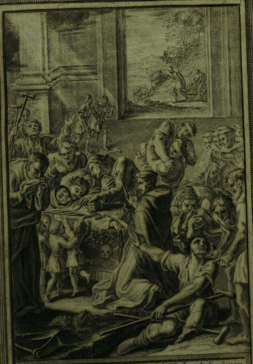
Puesto en el Feretro el Cuerpo del B. Apolinario, siguen a su contacto los Milagros.