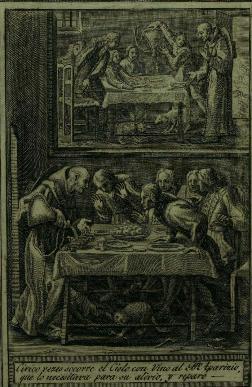
Cinco vezes socorre el Cielo con vino al Sr. Aparizio, que lo necesitava para su alivio, y reparo —

Faint, illegible text within a rectangular frame on the left page.