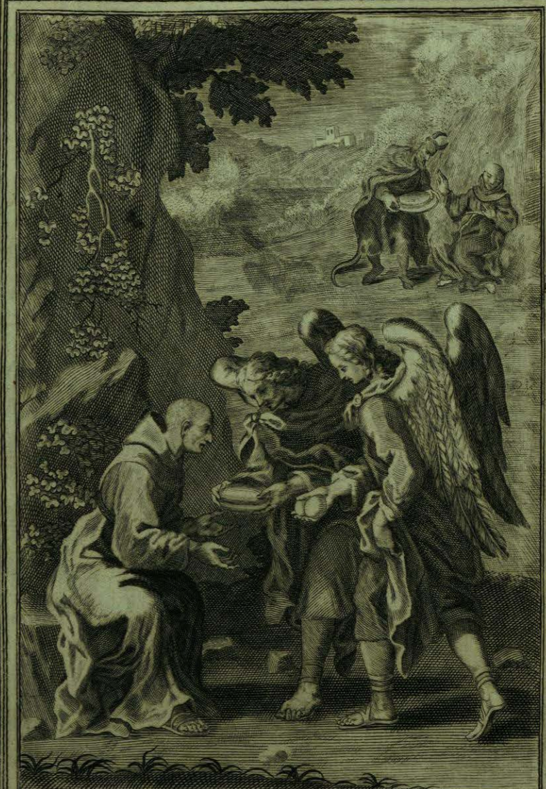
Socorren los Angeles en el Monte, con un pan, y dos huelos, al Ab te Aparizio, summiant e . necesitado -