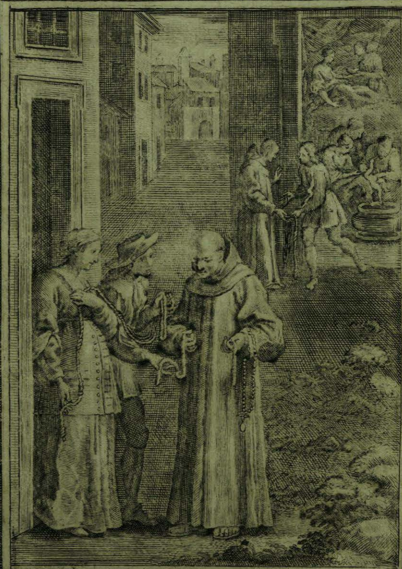
Da su cuerda el B to Aparicio a una Muger embarc rada, y pare con ella felizmente —