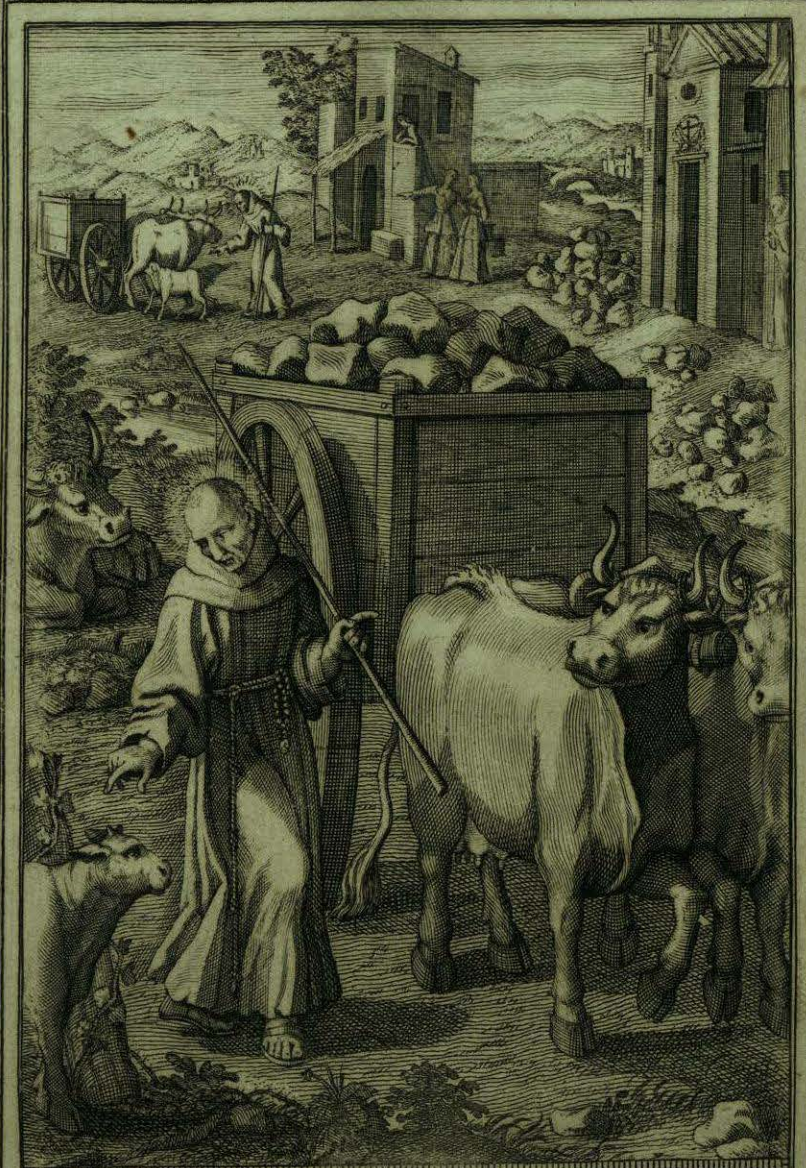
Manda el B. o Aparizio a un Bezerillo, que no siga a su Madre, y el le obedece puntualmente