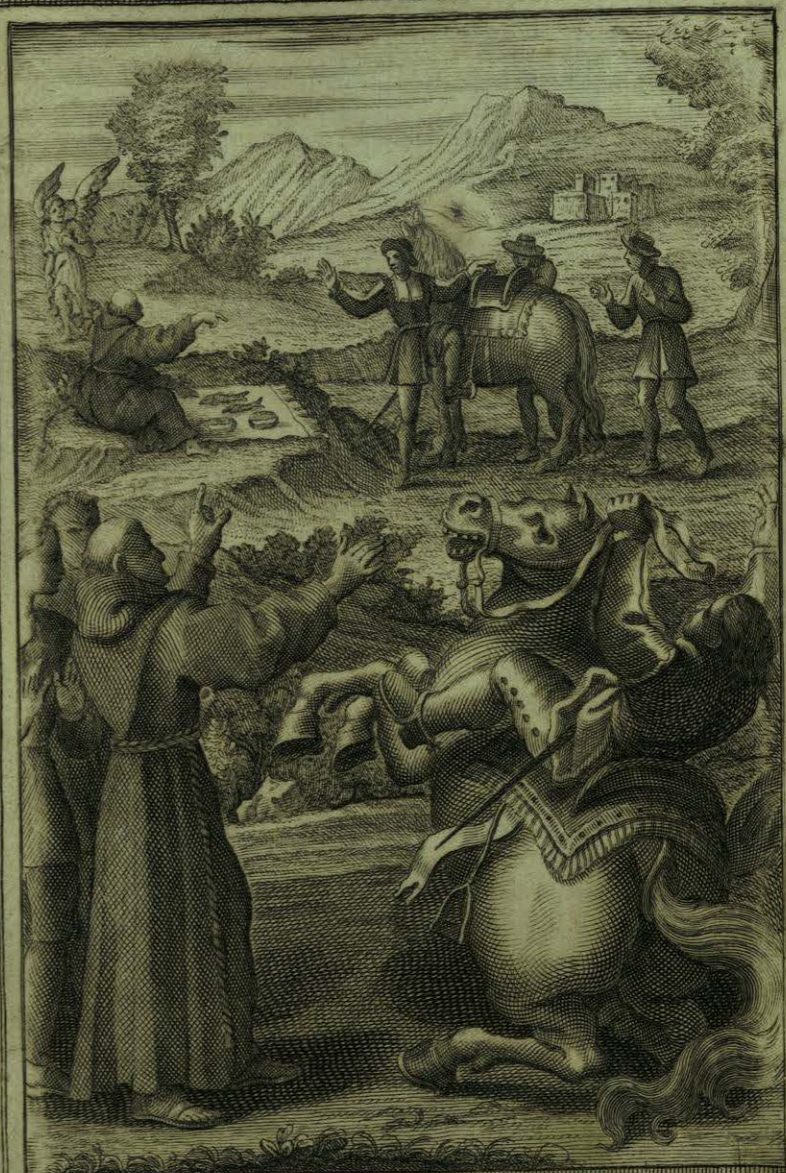
Socorren los Angeles con pan y pezes al Beato, y a un Amigo suyo, que caminaban por el Monte desfa Ursulo