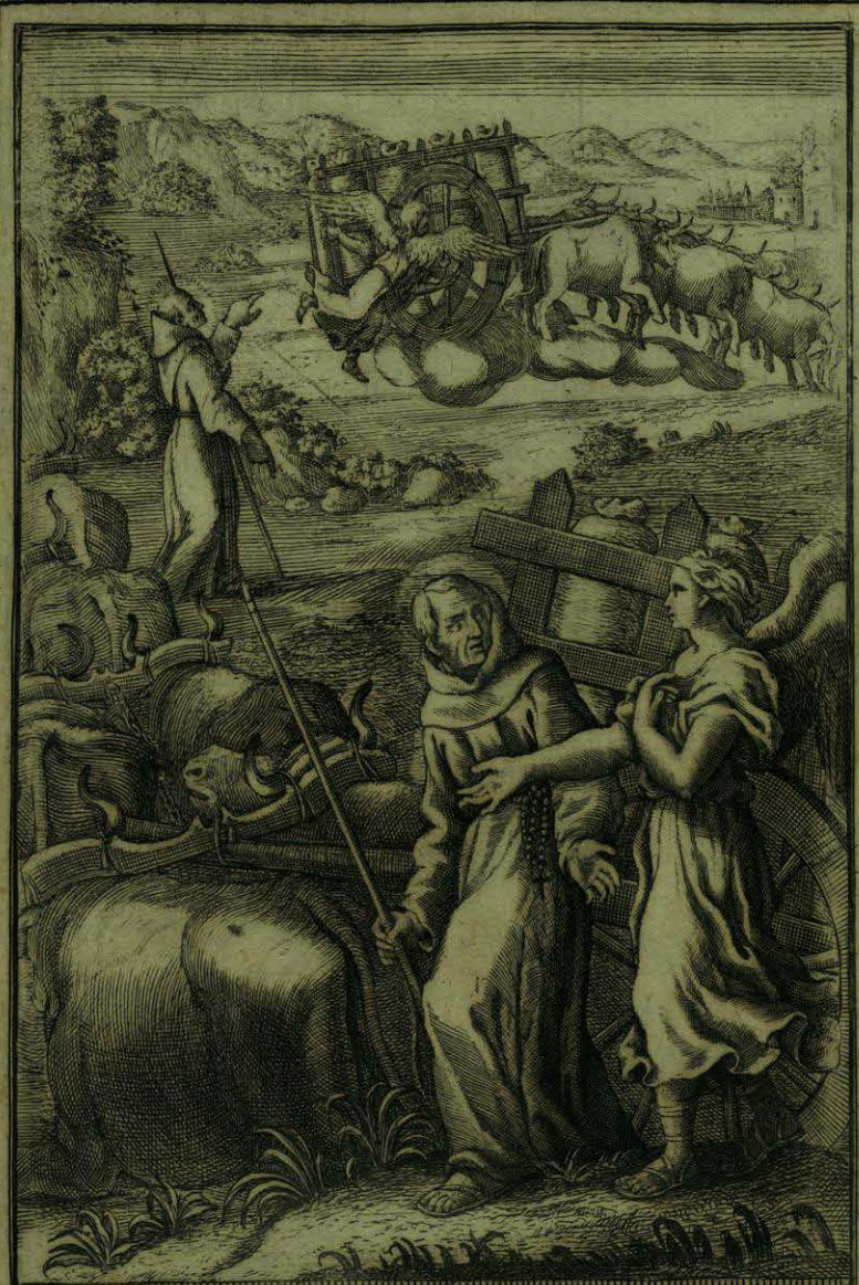
Sacante los Angeles al B. o Aparizio sus Carretes da una Barranca profunda, y se los ponen en camino llano

[Faint, illegible text, possibly bleed-through from the reverse side of the page.]