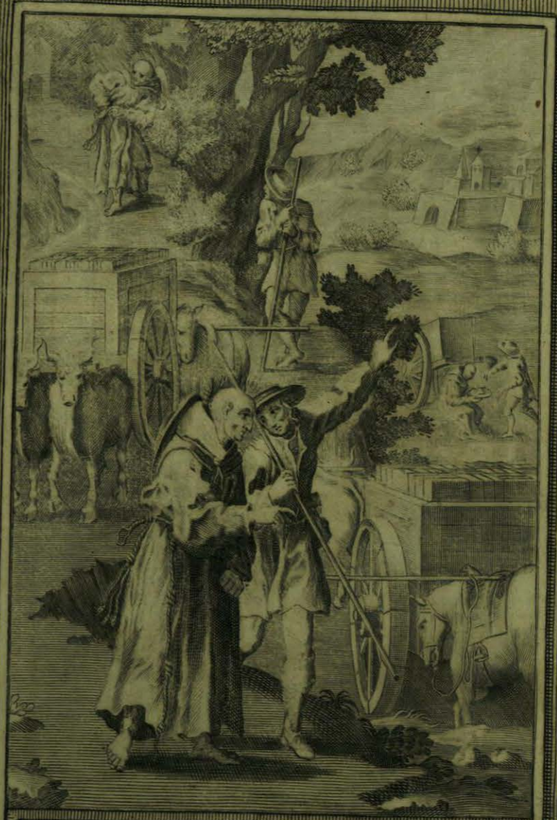
Despues de haber tomado el Sr. Aparicio una cruel disciplina, un Caminante vio correrle la sangre

Faint, illegible text, possibly bleed-through from the reverse side of the page.