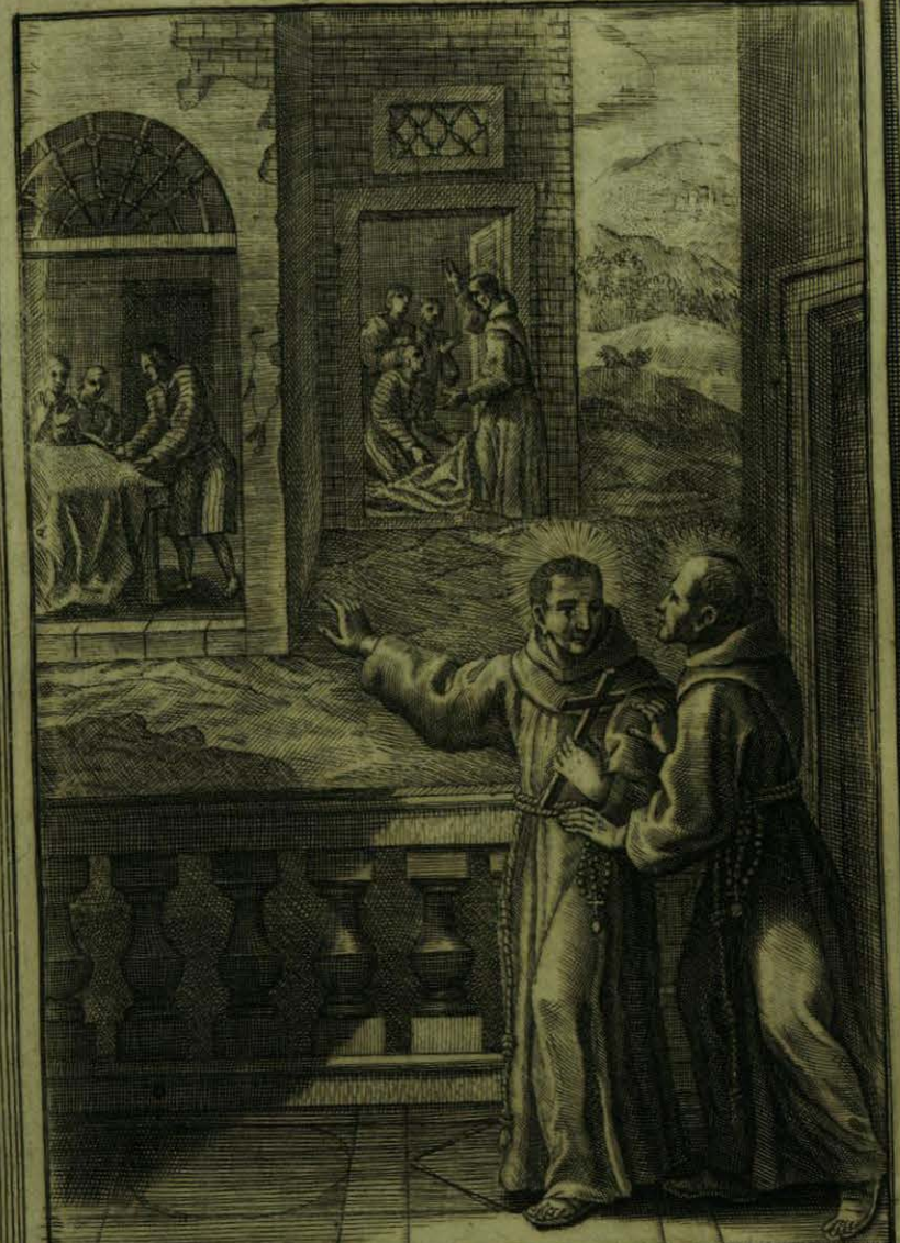
Pierde el B. o Aparicio su Manto, Aparecese S. o Diego de Alcalá, y le manifiesta donde esta