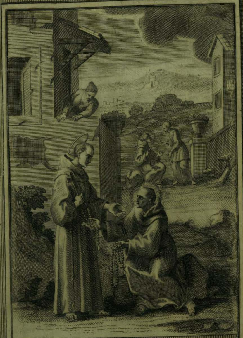
Apareziese S. n Diego al Beato Aparicio, y cambian sus Rosarios -

Faint, illegible text, possibly bleed-through from the reverse side of the page.