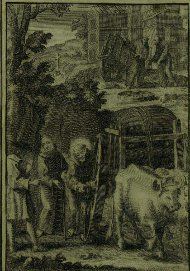
Caminando el B. Aparizio con el eje quebrado de un Carreta, S. n. Fran. co sostiene la rueda para que no caiga