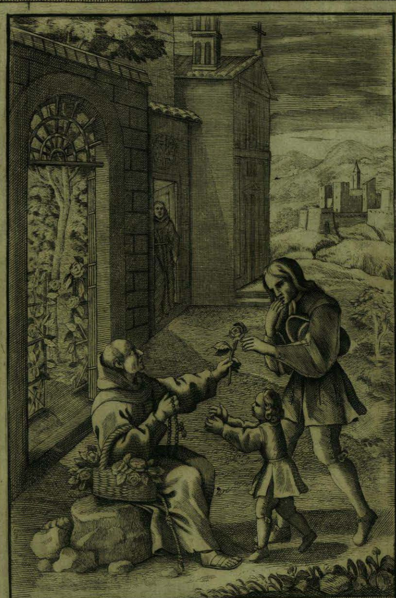
Pone el Guardian al P. Aparizio por custodio de un Rosa con prohibicion de que diese mas que una Rosa a cada uno

Faint, illegible text, possibly bleed-through from the reverse side of the page.