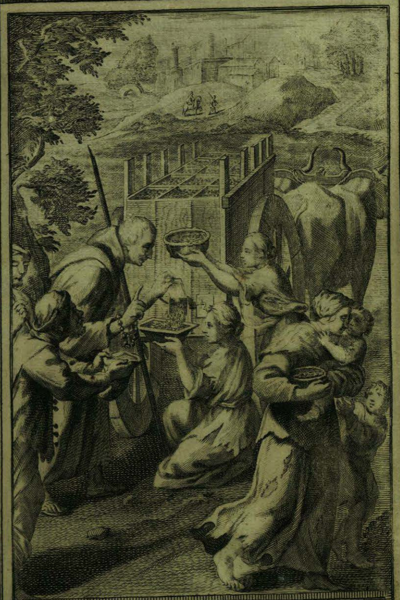
Da el P. limosna a los Pobres sin minuscavo de la que llevaba para el Convento

Faint, illegible text within a decorative border on the left page.