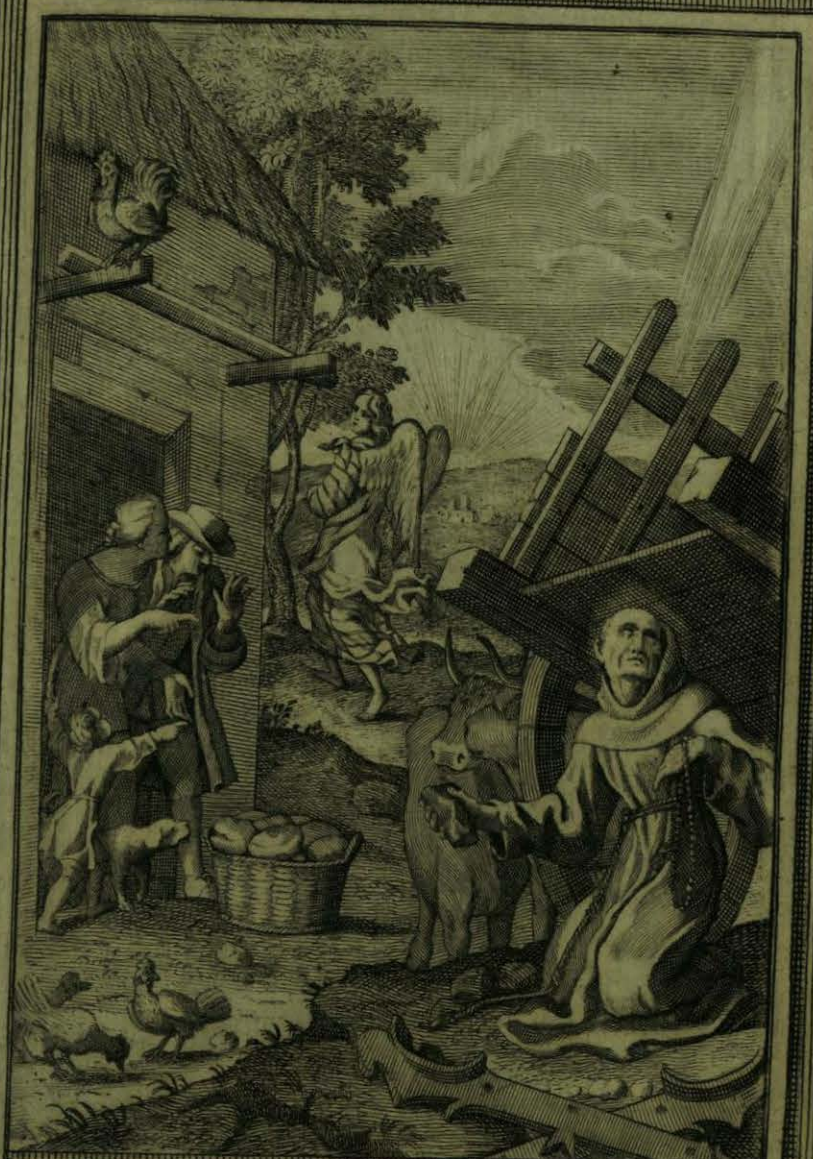
Buelve alas limosnas y Carretas el B. o Aparizio, y por sus ruegos socorre el Cielo con Pan a unq devoto su

Faint, illegible text within the rectangular frame on the left page.