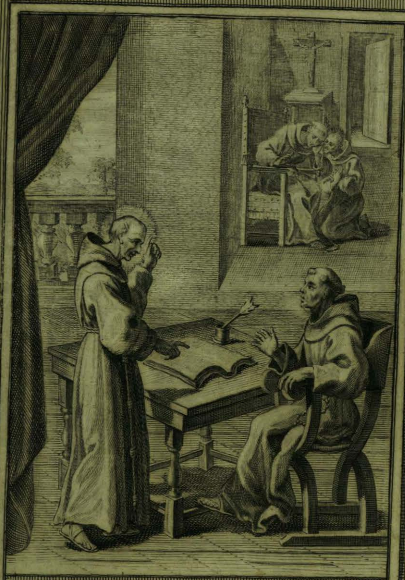
Apruevale al B. o Aparizio su Confesor su inteli- gencia de la Doctrina Christiana, y practica de confesã