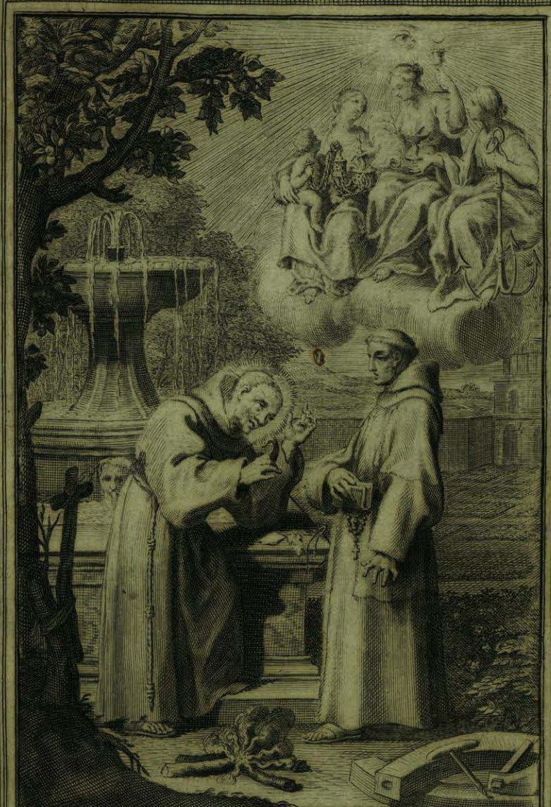
Discurre alant. el B. Aparicio con un Relig. Franciscano Descalzo, sobre puntos de Mística

Faint, illegible text, possibly bleed-through from the reverse side of the page.