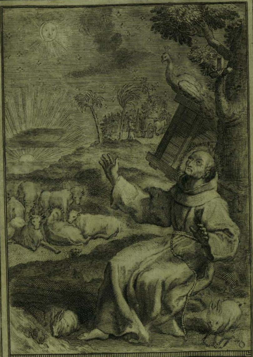
Pasa el B. to Aparizio á Cielo raso las noches enteras en el Monte, contemplando las grandezas de Dios.