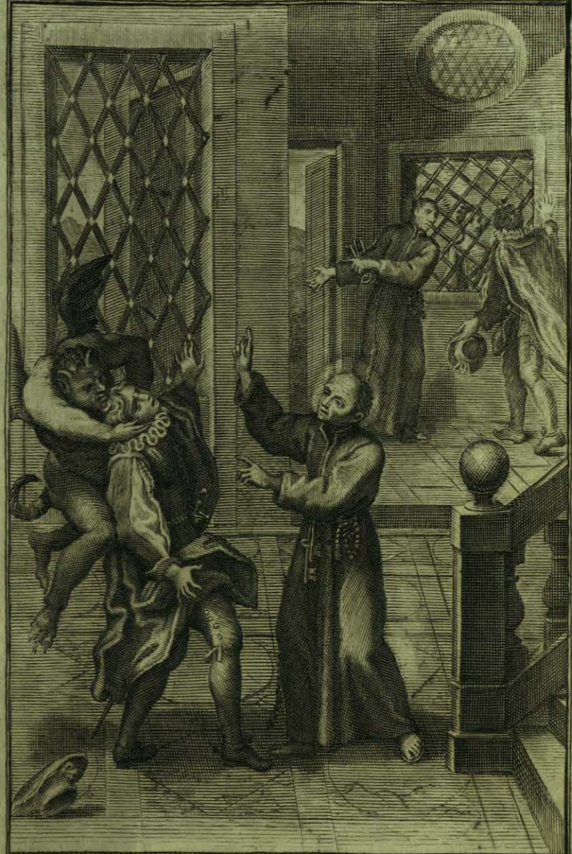
Viendo el B. o Aparicio que el Demonio queria haogar un Soben de mala vida, le avisa de supeligro.