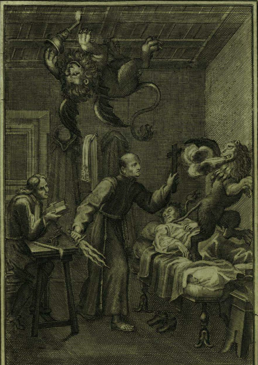
Conjura el P. o Aparizio a los Demonios, y los obliga à huirse a los Abismos