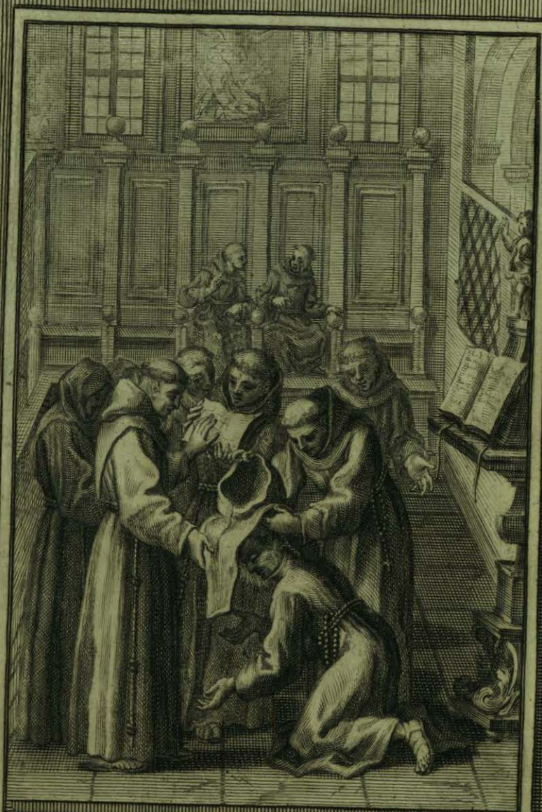
Toma el P. ro Aparicio el Habito de Lego en el Conv. to grande de S. ta Fran. co de Mexico.