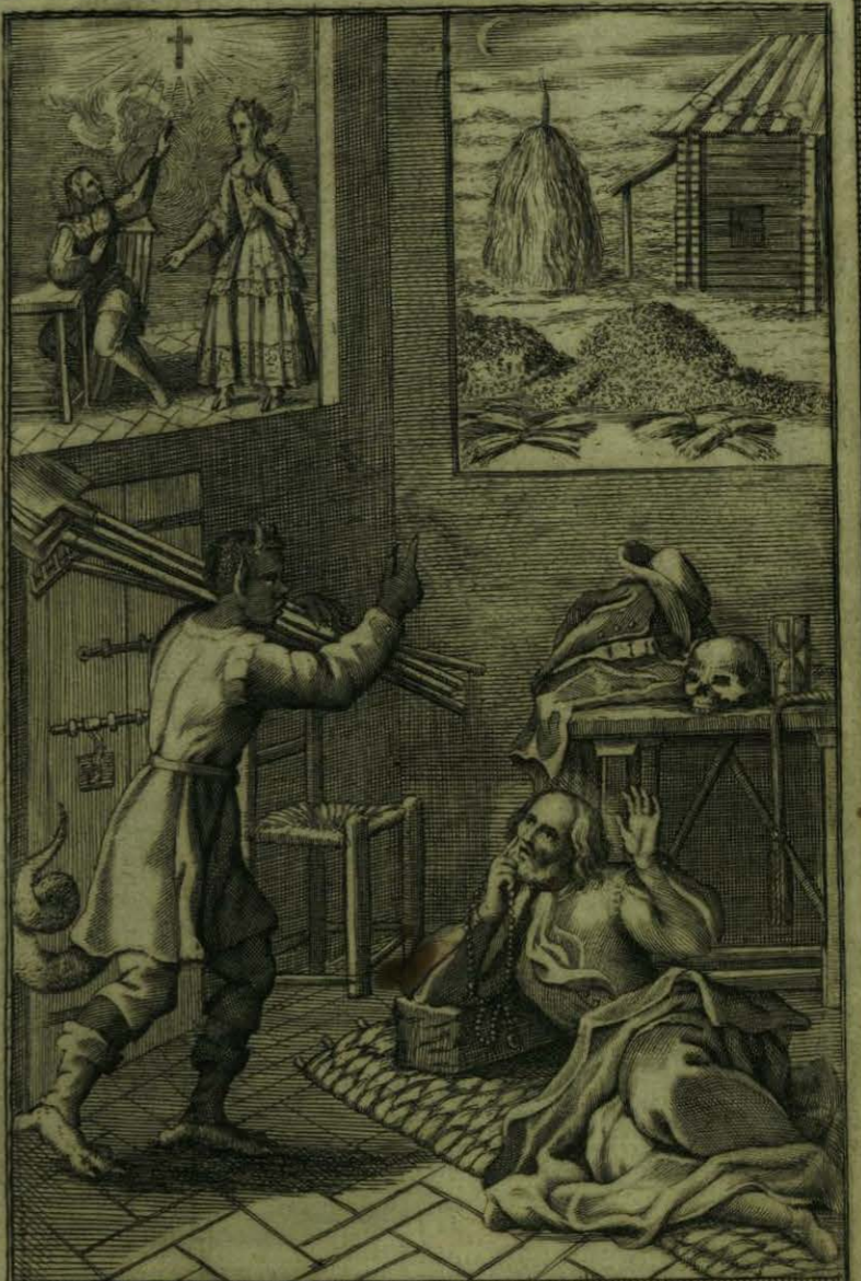
El Demonio en figura de Negro y cargado de horecas y palas, se le apareze al B. y le ofrez. su aiuda

[Faint, illegible text, likely bleed-through from the reverse side of the page.]