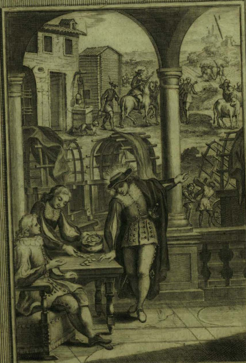
Vende el B. o Aparicio sus Carretas y con su producto compra una Hacienda de labranza