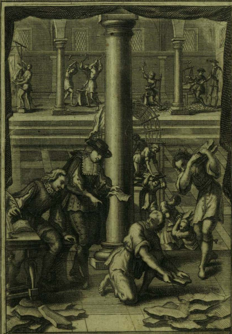
Entrega el B to Aparicio en la Real Casa de Moneda de Mexico las platas, que conduce de Zacatecas -

Faint, illegible text, possibly bleed-through from the reverse side of the page.