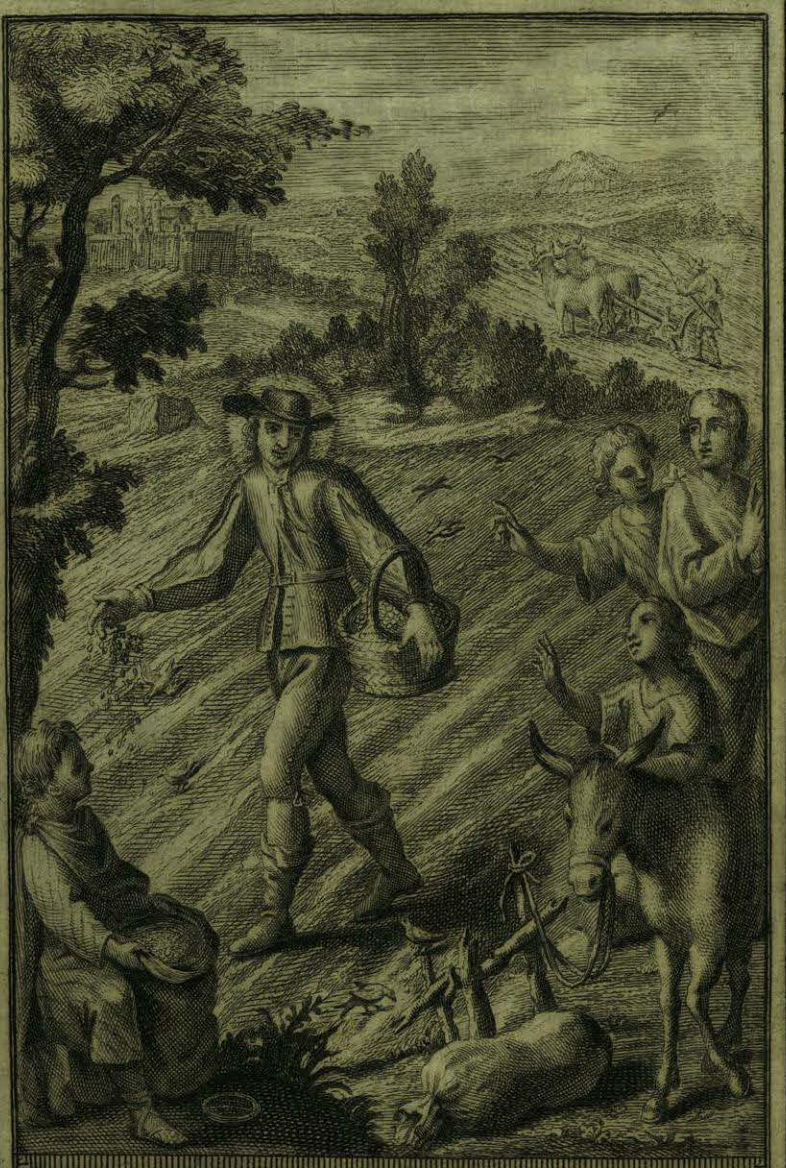
Exercitase el B. Aparicio en labrar, y sembrar sus tierras, y instruye a los Indios en estos oficios

Faint, mirrored text, likely bleed-through from the reverse side of the page.