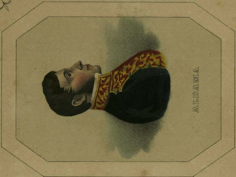
Lith. Thierry Freres, Cité Beffes, à Paris.