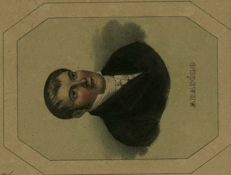
Lith. Thierry Freres, Cité Beffra, Paris

El curato linda por el Oriente con los de Marfil y Santa Ana: por el Norte con el de San Felipe: por el Sur con el de San Miguel, y por el Poniente con el de San Luis de la Paz. Su territorio comprende sesenta y ocho leguas cuadradas; en él hay dos pueblos, dos congregaciones, quince haciendas de campo, ciento trece ranchos anexos á ellas y once independientes que pertenecen á otros due-