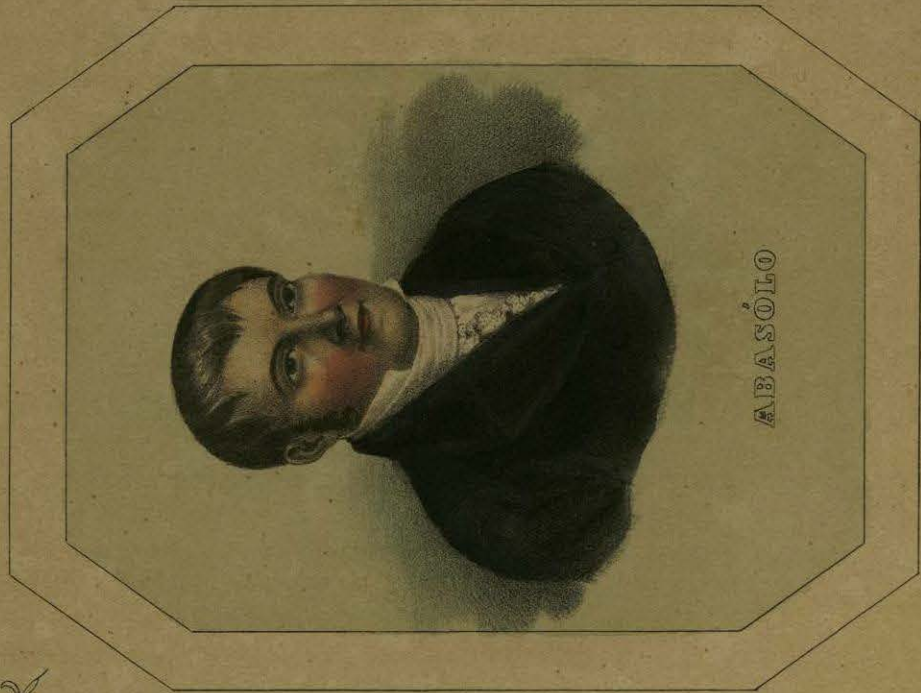
Lith. Thierry Freres, Cité Beffes, Paris.

El clima de Dolores es muy sano y su temperamento templado: en invierno se siente algo el frio. El viento dominante es el del Norte.