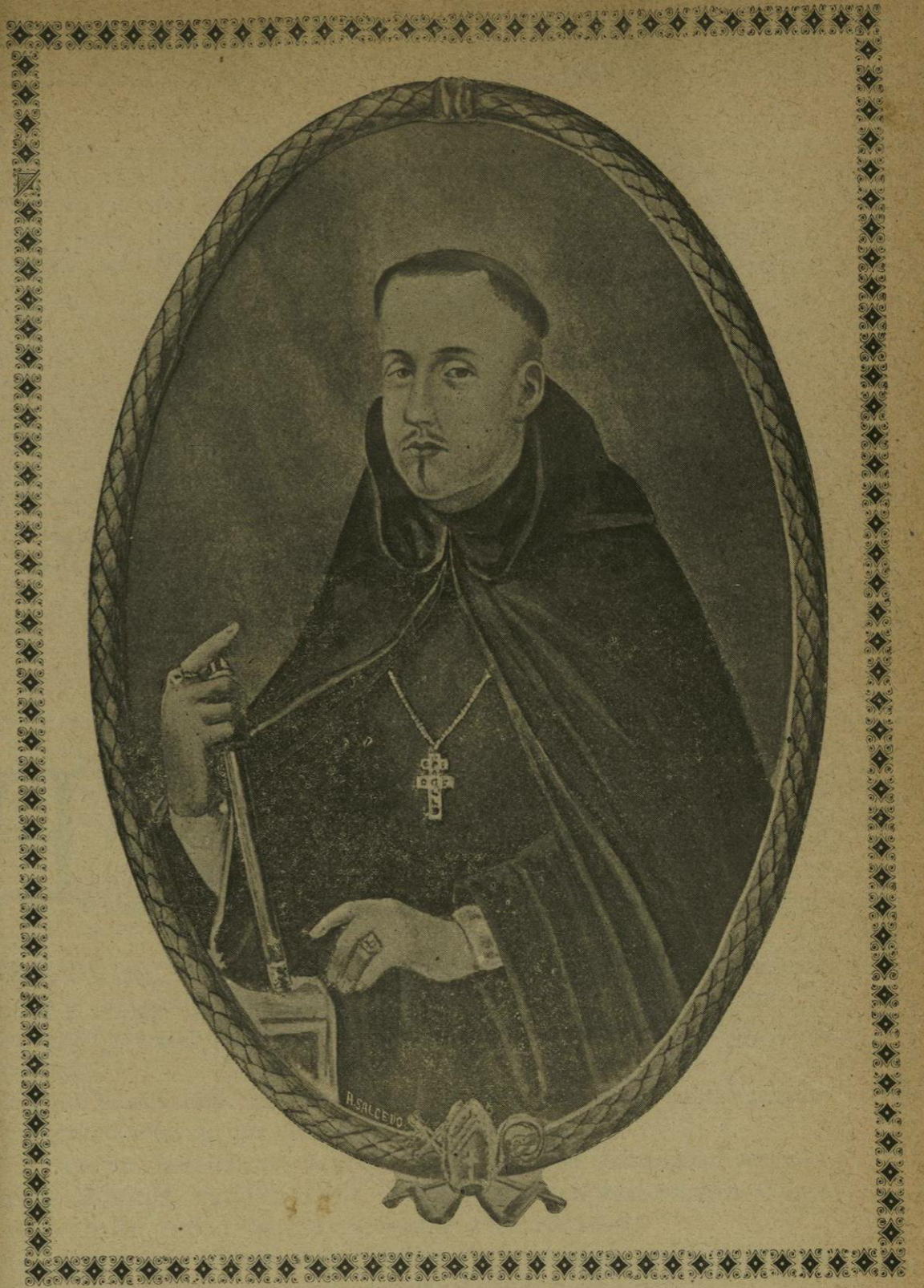
Ilmo. Sr. M. D. Fray Payo Enriquez de Rivera,

Natural de Sevilla, de los Señores Duques de Alcalá, del Orden de San Agustín, maestro en Filosofía y Teología; calificador del Santo Oficio; fué electo Obispo de Guatemala en el año de 1657, donde hizo obras heróicas en aumento de su Obispado, muy discreto y gran limosnero, imprimió un libro de la Concepción de Ntra. Señora, fué promovido á Arzobispo de México el año de 1668. Compuso la calzada que conduce al Santuario de Nuestra Señora de Guadalupe y casi la reedificó. Fue Virrey de esta Nueva España por muerte del Exmo. Sr. Duque de Veraguas desde el 13 de Diciembre de 1673 hasta el de 1680; fué su gobierno pacífico, renunció el virreinato y Arzobispado, fué preconizado Obispo de Cuenca que no aceptó, pasó á España el año de 1681 sin llegar á la Corte de esta ciudad Real, pasó al Convento de Ntra. Señora del Risco donde reducido á religioso absterio, falleció.